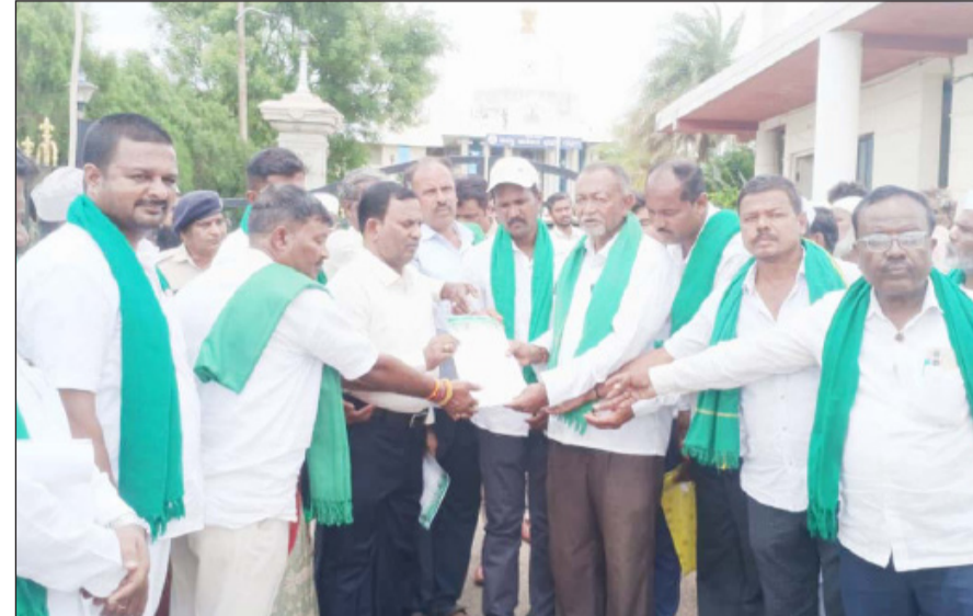
ಖಾಸಗೀಕರಣ ಜಾರಿಯಾದರೆ ರೈತರ ಪಂಪ್‌ಸೆಟ್‌ಗಳಿಗೆ ಮೀಟರ್ ಅಳವಡಿಕೆ, ಗ್ಯಾಜ್‌ಮೀಟರ್, ಭಾಗ್ಯಮೀಟರ್, ಕುಟೀರ ಜ್ಯೋತಿ, ಗಂಗಾ ಕಲ್ಯಾಣ ಸೇರಿದಂತೆ ವಿವಿಧ ಜನಪರ ಯೋಜನೆಗಳಿಗೆ ಹಿನ್ನಡೆಯಾಗಲಿದೆ. ಕೈಮಗ್ಗ ನೇಕಾರರು, ತೋಟಗಾರಿಕೆ ಬೆಳೆಗಾರರು, ಸಣ್ಣ ಕೈಗಾರಿಕೆಗಳು ಹಾಗೂ ಹೆಸ್ಟಾಂ ಕಾರ್ಮಿಕರು ಮೇಲೂ ದುಷ್ಪರಿಣಾಮ ಬೀರುವ ಸಾಧ್ಯತೆ ಇದೆ ಎಂದು ತಿಳಿಸಿದರು. ರಾಜ್ಯ ಸರ್ಕಾರ ಟಾಟಾ ಪವರ್ ಕಂಪನಿಗೆ ಪರವಾನಗಿ ನೀಡಬಾರದು. ಒಂದು ವೇಳೆ ಖಾಸಗೀಕರಣಕ್ಕೆ ಮುಂದಾದರೆ ರಾಜ್ಯಾದ್ಯಂತ ಬಂದ್, ಬಾಕೋೌಟ್ ಚಳವಳಿ ಹಾಗೂ ಜೈಲ್ ಭರೋ ಚಳವಳಿ ಹಮ್ಮಿಕೊಳ್ಳಲಾಗುವುದು ಎಂದು ತಿಳಿಸಿದರು.

ದೇಶದ 26 ಕೋಟಿ ವಿದ್ಯುತ್ ಗ್ರಾಹಕರಿಗೆ ಸ್ಯಾಟರ್ ಮೀಟರ್ ಅಳವಡಿಸುವ ಹೆಸರಿನಲ್ಲಿ ಪ್ರತಿ ಮೀಟರ್‌ಗೆ ಸುಮಾರು ₹8 ಸಾವಿರ ವೆಚ್ಚವಾಗಲಿದ್ದು, ಇದರಿಂದ ಲಕ್ಷಾಂತರ ಕೋಟಿ ರೂಪಾಯಿ ಖಾಸಗಿ ಕಂಪನಿಗಳ ಪಾಲಾಗಲಿದೆ ಎಂದು ಆರೋಪಿಸಿದರು. ವಿದ್ಯುತ್ ದರ ಏರಿಕೆ, ಸಬ್ಸಿಡಿ ಕಡಿತ ಹಾಗೂ ರೈತರ ಉಚಿತ ವಿದ್ಯುತ್ ಯೋಜನೆಗಳಿಗೆ ಧಕ್ಕೆಯಾಗುವ ಸಾಧ್ಯತೆ ಇದೆ ಎಂದು ಹೇಳಿದರು.