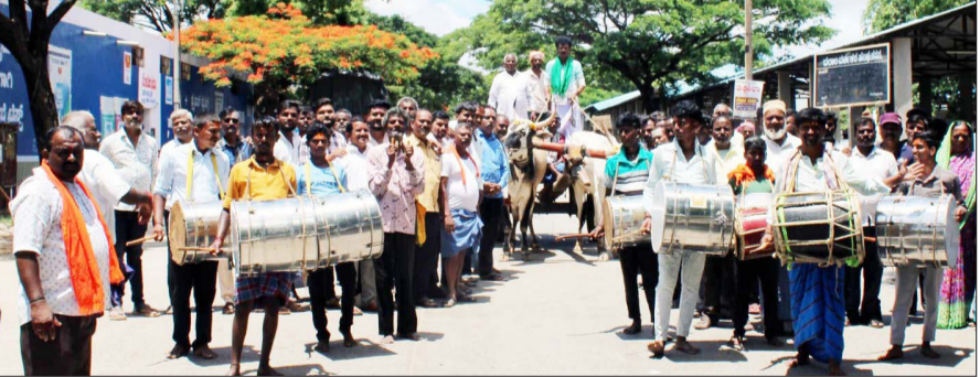
‘ರೈತನ ನಗು ಮರಳಲಿ’ ಮಳೆಗಾಗಿ ನಡೆದ ವಿಶೇಷ ಪೂಜೆಯಲ್ಲಿ ಭಾಗವಹಿಸಿದವರು. ಉತ್ತಮ ಮಳೆಯಾಗಿ ಕೃಷಿ ಉತ್ಪಾದನೆ ಹೆಚ್ಚುವಾಗಲಿ, ರೈತರ ಬದುಕು ಸಮೃದ್ಧಿಯಾಗಲಿ ಹಾಗೂ ಎಪಿಎಂಸಿ ಸೇರಿದಂತೆ ಗ್ರಾಮೀಣ ಆರ್ಥಿಕ ಚಟುವಟಿಕೆಗಳು ಮತ್ತೆ ಚೇತರಿಸಿಕೊಳ್ಳಲಿ ಎಂದು ವರುಣ ದೇವಾಲಯ ಪ್ರಾರ್ಥಿಸಲಾಯಿತು.

■ ವಿಜಯಸಾಕ್ಷಿ ಸುದ್ದಿ, ಗದಗ ಜಿಲ್ಲೆಯಲ್ಲಿ ನಿರೀಕ್ಷಿತ ಪ್ರಮಾಣದಲ್ಲಿ ಮಳೆಯಾಗದೇ ರೈತ ಸಮುದಾಯ ಸಂಕಷ್ಟಕ್ಕೆ ಸಿಲುಕಿರುವ ಹಿನ್ನೆಲೆಯಲ್ಲಿ, ಉತ್ತಮ ಮಳೆಯಾಗಿ ಕೃಷಿ ಚಟುವಟಿಕೆಗಳು ಚೇತರಿಸಿಕೊಳ್ಳಲಿ ಎಂಬ ಆಶಯದೊಂದಿಗೆ ಗದಗ ಎಪಿಎಂಸಿ ವ್ಯಾಪಾರ ವಲಯದ ವತಿಯಿಂದ ಸೋಮವಾರ ವಿವಿಧ ದೇವಾಲಯಗಳಲ್ಲಿ ವಿಶೇಷ ಪೂಜೆ ಹಾಗೂ ಪ್ರಾರ್ಥನೆ ಸಲ್ಲಿಸಲಾಯಿತು. ಮಳೆಯ ಕೊರತೆಯಿಂದ ಕೃಷಿ ಚಟುವಟಿಕೆಗಳು ಕುಂಠಿತಗೊಂಡಿದ್ದು, ರೈತರ ಉತ್ಪನ್ನಗಳು ಮಾರುಕಟ್ಟೆಗೆ ಆಗಮಿಸದ ಕಾರಣ ಗದಗ ಎಪಿಎಂಸಿಯ ವಹಿವಾಟು ಸೇರಿದಂತೆ ವ್ಯಾಪಾರ ಚಟುವಟಿಕೆಗಳ ಮೇಲೂ ಪರಿಣಾಮ ಬಿದ್ದಿದೆ. ಇದರ ಪರಿಣಾಮವಾಗಿ ದಲಾಯರು, ವ್ಯಾಪಾರಸ್ಥರು, ಹರಕೂಲರು, ಚಿಕ್ಕಡಿಯವರು, ಹಮಾಲರು ಹಾಗೂ ಕೃಷಿ ಆಧಾರಿತ ಕಾರ್ಮಿಕ ವರ್ಗದ ಜೀವನೋಪಾಯಕ್ಕೂ ಸಂಕಷ್ಟ ಎದುರಾಗಿದೆ. ಈ ಹಿನ್ನೆಲೆಯಲ್ಲಿ ಗದಗ ಎಪಿಎಂಸಿಯ ಬಸವಣ್ಣ ದೇವಸ್ಥಾನ, ವೀರೇಶ್ವರ ಪುಣ್ಯಾಶ್ರಮ, ಬನ್ನಿಮಹಾಂಕಾಳಿ ದೇವಸ್ಥಾನ,