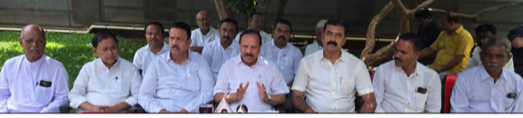
“ಮೋದಿ ಸರ್ಕಾರದ 12 ವರ್ಷಗಳ ಕೇವಲ ಆಡಳಿತದ ಅವಧಿಯಲ್ಲೇ ಅದು ಬಡವರ ಬದುಕು ಬದಲಿಸಿದೆ, ದೇಶದ ಆತ್ಮವಿಶ್ವಾಸ ಹೆಚ್ಚಿಸಿದೆ ಮತ್ತು ವಿಕಸಿತ ಭಾರತದ ಅಡಿಪಾಯ ಹಾಕಿದೆ ಸುಖೋದಯಗವಾಗಿದೆ.” - ಡಿ.ಎ. ಸದಾನಂದಗೌಡ, ಮಾಜಿ ಮುಖ್ಯಮಂತ್ರಿ

■ ವಿಜಯಸಾಕ್ಷಿ ಸುದ್ದಿ, ಗದಗ ಪ್ರಧಾನಮಂತ್ರಿ ನರೇಂದ್ರ ಮೋದಿ ಅವರ ನೇತೃತ್ವದಲ್ಲಿ ಕಳೆದ 12 ವರ್ಷಗಳಲ್ಲಿ ಭಾರತವು ಕೇವಲ ತನ್ನ ಚಿತ್ರಣವನ್ನಷ್ಟೇ ಅಲ್ಲ, ತನ್ನ ಅದೃಷ್ಟವನ್ನೂ ಬದಲಿಸಿಕೊಂಡಿದೆ ಎಂದು ಮಾಜಿ ಮುಖ್ಯಮಂತ್ರಿ ಡಿ.ಎ. ಸದಾನಂದಗೌಡ ಹೇಳಿದರು. ನಗರದಲ್ಲಿ ನಡೆದ ಪತ್ರಿಕಾಗೋಷ್ಠಿಯಲ್ಲಿ ಮಾತನಾಡಿದ ಅವರು, 2014ರಿಂದ ಆರಂಭವಾದ ಮೋದಿ ಸರ್ಕಾರದ ಆಡಳಿತವು ಸುಶಾಸನ, ಅಭಿವೃದ್ಧಿ ಹಾಗೂ ಜನಕಲ್ಯಾಣದ ಹೊಸ ಅಧ್ಯಾಯಕ್ಕೆ ನಾಂದಿ ಹಾಡಿದೆ. 2014, 2019 ಮತ್ತು 2024ರಲ್ಲಿ ಸತತ ಮೂರು ಬಾರಿ ಜನರು ಬಿಜೆಪಿ ನೇತೃತ್ವದ ಸರ್ಕಾರಕ್ಕೆ ಅಧಿಕಾರ ನೀಡಿರುವುದು ಪ್ರಧಾನಿ ಮೋದಿ ಅವರ ಮೇಲಿನ ಜನಪ್ರಿಯತೆಗೆ ಸಾಕ್ಷಿಯಾಗಿದೆ ಎಂದು ಹೇಳಿದರು.