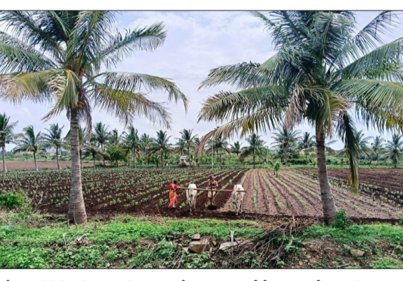
ಹೊಲಗಳತ್ತ ಮುಖ ಮಾಡಿದ್ದಾರೆ. ಶಿರಹಟ್ಟಿ ತಾಲೂಕಿನಲ್ಲಿ ಒಟ್ಟು 51,698 ಹೆಕ್ಟೇರ್ ಭಾಗೀರಥಿ ಕೃಷಿ ಮಿಷನ್ ಅಡಿಯಲ್ಲಿ 46,735 ಹೆಕ್ಟೇರ್ ಪ್ರದೇಶ ಕೃಷಿಗೆ ಯೋಗ್ಯವಾಗಿದೆ. ಪ್ರಸಕ್ತ ಮುಂಗಾರು ಹಂಗಾಮಿನಲ್ಲಿ 36,430 ಹೆಕ್ಟೇರ್ ಪ್ರದೇಶದಲ್ಲಿ ಬಿತ್ತನೆ ಮಾಡುವ ಗುರಿ ಹೊಂದಲಾಗಿದೆ. ಈಗಾಗಲೇ 10,355 ಹೆಕ್ಟೇರ್ ಪ್ರದೇಶದಲ್ಲಿ ವಿವಿಧ ಬೆಳೆಗಳ ಬಿತ್ತನೆ ಪೂರ್ಣಗೊಂಡಿದೆ. ಮೆಕ್ಕೆಜೋಳ 8,500 ಹೆಕ್ಟೇರ್, ಹೆಸರು 1,220 ಹೆಕ್ಟೇರ್, ತೆ-ಗೊಗೆ 550 ಹೆಕ್ಟೇರ್, ಶೇಂಗಾ

■ ವಿಜಯಸಾಕ್ಷಿ ಸುದ್ದಿ, ಶಿರಹಟ್ಟಿ ಮುಂಗಾರು ಆರಂಭದಲ್ಲೇ ಉತ್ತಮ ಮಳೆಯಾಗಿರುವುದು ಶಿರಹಟ್ಟಿ ತಾಲೂಕಿನ ರೈತರಲ್ಲಿ ಹೊಸ ಆಶಾಭಾವನೆ ಮೂಡಿಸಿದ್ದು, ತಾಲೂಕಿನಾದ್ಯಂತ ಬಿತ್ತನೆ ಕಾರ್ಯ ಜೋರಾಗಿ ಸಾಗುತ್ತಿದೆ. ವಾರ್ಷಿಕವಾಗಿ ಶೇ.35ರಷ್ಟು ಅಧಿಕ ಮಳೆಯಾಗಿರುವ ಹಿನ್ನೆಲೆಯಲ್ಲಿ ಹೊಲಗಳು ಹದಗೊಂಡಿದ್ದು, ರೈತರು ಬೀಜ ಮತ್ತು ಗೊಬ್ಬರಗಳೊಂದಿಗೆ ಕೃಷಿ ಚಟುವಟಿಕೆಗಳಲ್ಲಿ ತೊಡಗಿದ್ದಾರೆ. ತಾಲೂಕಿನಲ್ಲಿ ಜನವರಿ 10ರಿಂದ ಜೂನ್ 4ರವರೆಗೆ 130.9 ಮಿ.ಮೀ. ವಾರ್ಷಿಕ ಮಳೆಯಾಗಬೇಕಾಗಿತ್ತು. ಆದರೆ ಇದೇ ಅವಧಿಯಲ್ಲಿ 176.9 ಮಿ.ಮೀ. ಮಳೆಯಾಗಿದ್ದು, ಶೇ.35ರಷ್ಟು ಹೆಚ್ಚುವರ ಮಳೆ ದಾಖಲಾಗಿದೆ. ಮುಂಗಾರು ಪೂರ್ವದಲ್ಲಿಯೇ ಆಗಿದಾಗ್ಯೂ ಸುಂದ ಮಳೆಯಿಂದ ರೈತರು ತಮ್ಮ ಜಮೀನುಗಳನ್ನು ಬಿತ್ತನೆಗೆ ಸಿದ್ಧ ಪಡಿಸಿಕೊಂಡಿದ್ದಾರೆ. ಇದೀಗ ಜಮೀನುಗಳು ಬಿತ್ತನೆಗೆ ಯೋಗ್ಯವಾಗಿರುವುದರಿಂದ ರೈತರು ಬೀಜ-ಗೊಬ್ಬರ ಖರೀದಿಸಿ