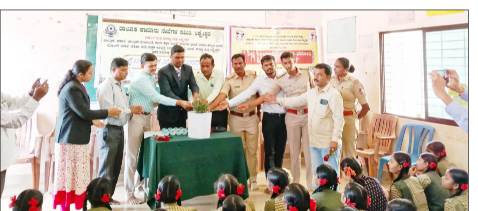
ಯಾವ ಮಗುವೂ ವಂಚಿತರಾಗಬಾರದು. ಹೆಚ್ಚಿನ ಜಾಗೃತಿ ಮೂಡಿಸುವ ಅಗತ್ಯವಿದೆ. ಮಕ್ಕಳಿಗೆ ಬಾಲಕಾರ್ಮಿಕ ಪದ್ಧತಿ ನಿರ್ಮೂಲನೆಗೆ ಸಮಾಜದಲ್ಲಿ ಶಿಕ್ಷಣದ ಹಕ್ಕು ದೊರಕುವಂತೆ ಪ್ರತಿಯೊಬ್ಬರೂ