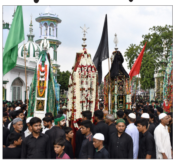
ಬೆಸಿದುಕೊಂಡ ಮತ್ತೊಂದು ಐತಿಹಾಸಿಕ ಮಹಮ್ಮದ್ (ಸ) ಅವರ ಮೊಮ್ಮಗ ಹರೂತ್ ಮುಸೈನ್ (ರ) ಅವರು ಅನ್ಯಾಯ ಮತ್ತು ದುರ್ಬಲಗೊಳಿಸಿದ ವಿರುದ್ಧ ತಲೆಬಾಗದ ಸತ್ಯ ಹಾಗೂ ನ್ಯಾಯಕ್ಕಾಗಿ ತಮ್ಮ ಕುಟುಂಬದೊಂದಿಗೆ ತ್ಯಾಗ ಬಲಿದಾನ ನೀಡಿದರು. ಕರ್ಬಲಾದ ಈ ವರ್ಷದ ಆರಂಭದೊಂದಿಗೆ ಆತ್ಮಶುದ್ಧಿ, ಸತ್ಕಾರ್ಯ ಮತ್ತು ದೇವಭಕ್ತಿಗೆ ಹೊಸ ಸಂಕಲ್ಪ ಮಾಡುವ ಪವಿತ್ರ ಸಮಯವೆಂದು ಪರಿಗಣಿಸಲಾಗುತ್ತದೆ. ಹರೂತ್ ಮುಸೈನ್ (ರ) ಅವರ ಬಲಿದಾನವು ಅಧಿಕಾರಕ್ಕಾಗಿ ನಡೆದ

ಮೊಹರಂ ಇಸ್ಲಾಮ್ ಒಟ್ಟಿ ವರ್ಷದ ಮೊದಲ ತಿಂಗಳಾಗಿದ್ದು, ಮುಸ್ಲಿಮರಲ್ಲಿ ಅತ್ಯಂತ ಪವಿತ್ರ ಮಾಸಗಳಲ್ಲಿ ಒಂದಾಗಿದೆ. ಈ ತಿಂಗಳು ಹೊಸ ವರ್ಷದ ಆರಂಭ ಮಾತ್ರವಲ್ಲ, ತ್ಯಾಗ, ನ್ಯಾಯ, ಧೈರ್ಯ, ಕೃತಜ್ಞತೆ ಹಾಗೂ ಆತ್ಮಾವಲೋಕನದ ಸಂದೇಶವನ್ನು ಸಾರುವ ಮಹತ್ವದ ಸಂದರ್ಭವಾಗಿದೆ. ಮೊಹರಂ ಹತ್ತನೇ ದಿನವಾದ ಅಶೂರಾ ದಿನವು ಇಸ್ಲಾಮಿನ ಇತಿಹಾಸದಲ್ಲಿ ವಿಶೇಷ ಸ್ಥಾನ ಪಡೆದಿದೆ. ಈ ದಿನ ಅಲ್ಲಾಹನು ಪ್ರವಾದಿ ಹರೂತ್ ಮೂಸಾ (ಅ) ಮತ್ತು ಅವರ ಸಮುದಾಯವನ್ನು ಫಿರಾನ್ ನದಿ ದಡದಲ್ಲಿ ದುರ್ಬಲಗೊಳಿಸಿದನೆಂದು ಇಸ್ಲಾಮ್ ಸಂಪ್ರದಾಯ ತಿಳಿಸುತ್ತದೆ. ಈ ಕಾರಣದಿಂದ ಪ್ರವಾದಿ ಹರೂತ್ ಮುಹಮ್ಮದ್ (ಸ) ಅವರು ಅಶೂರಾ ದಿನ ಉಪವಾಸ ಆಚರಿಸಿದ್ದು, ತಮ್ಮ ಅನುಯಾಯಿಗಳಿಗೂ ಉಪವಾಸ ಆಚರಿಸುವಂತೆ ಪ್ರೇರೇಪಿಸಿದ್ದರು. ಪ್ರವಾದಿ ಮುಹಮ್ಮದ್ (ಸ) ಅವರು ಮಕ್ಕಾದಿಂದ ಮದಿನೆಗಾಗಿ ಹಿಜ್ರತ್ ಮಾಡಿದ ಘಟನೆಯಿಂದಲೇ ಇಸ್ಲಾಮ್ ಹಿಜ್ರಿ ಕ್ಯಾಲೆಂಡರ್ ಆರಂಭವಾಗುತ್ತದೆ. ಆದ್ದರಿಂದ ಮೊಹರಂ ತಿಂಗಳು ಹೊಸ ವರ್ಷದ ಆರಂಭದೊಂದಿಗೆ ಆತ್ಮಶುದ್ಧಿ, ಸತ್ಕಾರ್ಯ ಮತ್ತು ದೇವಭಕ್ತಿಗೆ ಹೊಸ ಸಂಕಲ್ಪ ಮಾಡುವ ಪವಿತ್ರ ಸಮಯವೆಂದು ಪರಿಗಣಿಸಲಾಗುತ್ತದೆ. ಮೊಹರಂ ತಿಂಗಳೊಂದಿಗೆ