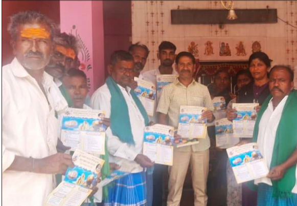
ಮಕ್ಕಳಿಗೆ ಆಸ್ತಿ ಮಾಡುವುದಕ್ಕಿಂತ ಉತ್ತಮ ಶಿಕ್ಷಣ ನೀಡುವುದು ಮುಖ್ಯ. ಉತ್ತಮ ಶಿಕ್ಷಣ ಮತ್ತು ಸಂಘಟನೆಯಿಂದ ಸಮಾಜದ ಭವಿಷ್ಯ ಉಜ್ವಲವಾಗುತ್ತದೆ.