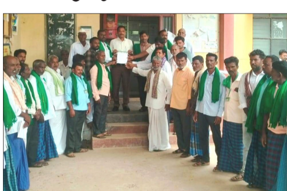
ಪ್ರವೇಶಿಸಿದ ಪರಿಣಾಮ ರೈತರು ಹಾಗೂ ಸಾಮಾನ್ಯ ಗ್ರಾಹಕರು ಸಂಘಟನೆ ಅನುಭವಿಸುತ್ತಿದ್ದಾರೆ.