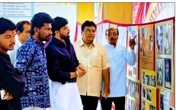
ಮಹತ್ವದ ಕಾರ್ಯ ನಡೆಯುತ್ತಿದೆ. ಇಂತಹ ಪ್ರದರ್ಶನಗಳು ಯುವಕರಿಗೆ ಪ್ರೇರಣೆ ಮತ್ತು ಮಾರ್ಗದರ್ಶನ ನೀಡುತ್ತವೆ ಎಂದು ಅವರು ಅಭಿಪ್ರಾಯಪಟ್ಟರು.