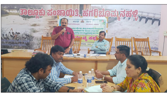
ಅಲಕ್ಷ್ಮಿ ಪಂಚಾಯಿತಿ, ಹಗರಿಬೋಮ್ಮನಹಳ್ಳಿ