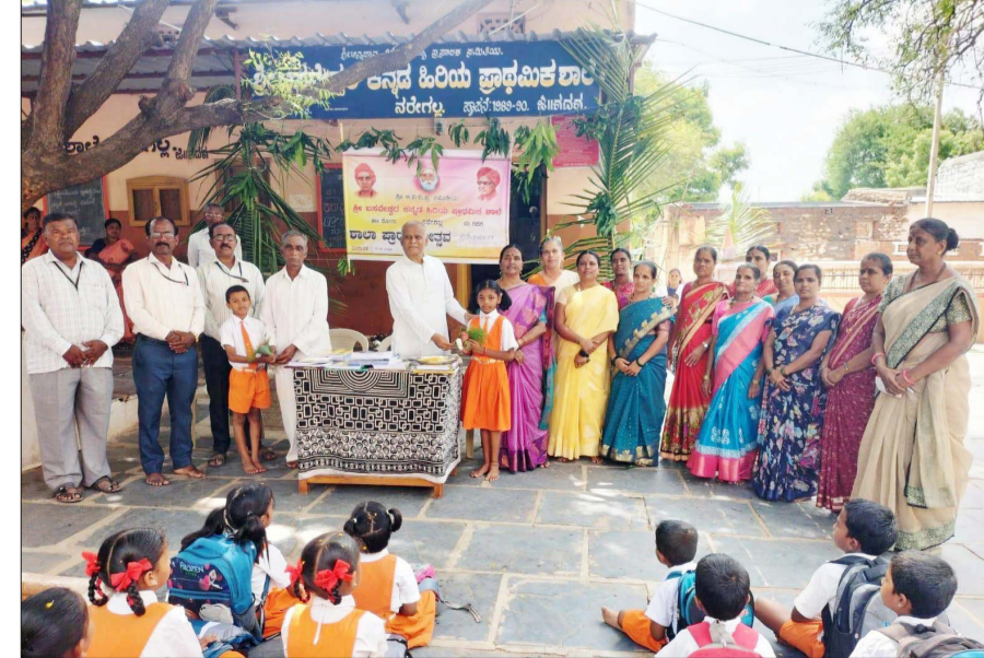
ಹೊರಬಂದು ಮಕ್ಕಳು ಹೆಗಲ ಮೇಲೆ ಬ್ಯಾಗ್ ಹಾಕಿಕೊಂಡು ಶಾಲೆಗಳತ್ತ ಹೆಜ್ಜೆ ಹಾಕಿದ ದೃಶ್ಯ ಗಮನ ಸೆಳೆಯಿತು. ಮೊದಲ ದಿನವಾಗಿದ್ದರಿಂದ ವಿದ್ಯಾರ್ಥಿಗಳ

■ ವಿಜಯಸಾಕ್ಷಿ ಸುದ್ದಿ, ನರೇಗಲ್ಲ ಎರಡು ತಿಂಗಳ ಬೇಸಿಗೆ ರಜೆಯ ಬಳಿಕ 2026-27ನೇ ಸಾಲಿನ ಶೈಕ್ಷಣಿಕ ವರ್ಷ ಆರಂಭವಾಗುತ್ತಿದ್ದಂತೆ ನರೇಗಲ್ಲ ಪಟ್ಟಣ ಹಾಗೂ ಹೋಬಳಿ ವ್ಯಾಪ್ತಿಯ ಸರ್ಕಾರಿ ಮತ್ತು ಖಾಸಗಿ ಶಾಲೆಗಳಲ್ಲಿ ಸೋಮವಾರ ಶಾಲಾ ಪ್ರಾರಂಭೋತ್ಸವ ಸಂಭ್ರಮದಿಂದ ಜರುಗಿತು. ಮೊದಲ ದಿನವೇ ಮಕ್ಕಳಲ್ಲಿ ಎಲ್ಲಿಲ್ಲದ ಉತ್ಸಾಹ ಮತ್ತು ಹುರುಪು ಕಂಡುಬಂತು. ಶಾಲೆಗಳನ್ನು ಬಾಳೆಕಂಬ, ಹೂವು ಹಾಗೂ ಮಾವಿನ ತೋರಣಗಳಿಂದ ಸಿಂಗರಿಸಲಾಗಿತ್ತು. ವಿದ್ಯಾರ್ಥಿಗಳಿಗೆ ಗುಲಾಬಿ ಹೂ ನೀಡಿ, ಸಿಹಿ ಹಂಪು ಮೂಲಕ ಆತ್ಮೀಯ ಸ್ವಾಗತ ಕೊರಲಾಯಿತು. ಸರ್ಕಾರದಿಂದ ನೀಡಲಾದ ಉಚಿತ ಪಠ್ಯಪುಸ್ತಕ ಹಾಗೂ ಸಮವಸ್ತ್ರಗಳನ್ನು ವಿತರಿಸಲಾಯಿತು. ಬೇಸಿಗೆ ರಜೆಯ ಮುಷಿಯಿಂದ