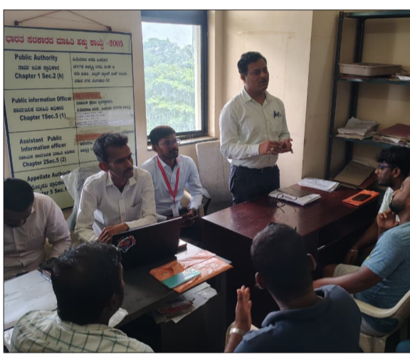
ಹಮ್ಮಿಕೊಂಡಿದ್ದು ಮಾರ್ಗದರ್ಶನ ಕಾರ್ಯಕ್ರಮದಲ್ಲಿ ಮಾತನಾಡಿದ ಸರ್ಕಾರ ಶೇ.50ರಷ್ಟು ಸಹಾಯಧನ ನೀಡುತ್ತಿದ್ದು,

■ ವಿಜಯಸಾಕ್ಷಿ ಸುದ್ದಿ, ಗದಗ ನಿರುದ್ಯೋಗಿ ಯುವಕರಿಗೆ ಸ್ವಯಂ ಉದ್ಯೋಗದ ಮೂಲಕ ಆರ್ಥಿಕ ಸ್ವಾವಲಂಬನೆ ಕಲ್ಪಿಸುವ ಉದ್ದೇಶದಿಂದ ರಾಜ್ಯ ಸರ್ಕಾರ ಜಾರಿಗೆ ತಂದಿರುವ “ನ್ಯಾವಲಂಬಿ ಸಾರಥಿ ಯೋಜನೆ” ಮಹತ್ವಾಕಾಂಕ್ಷಿ ಯೋಜನೆಯಾಗಿದೆ ಎಂದು ಡಿ. ದೇವರಾಜ ಅರಸು ಹಿಂದುಳಿದ ವರ್ಗಗಳ ಅಭಿವೃದ್ಧಿ ನಿಗಮದ ಜಿಲ್ಲಾ ವ್ಯವಸ್ಥಾಪಕ ನಿರ್ದೇಶಕರು ಹೇಳಿದರು. ಗದಗ ಜಿಲ್ಲಾ ಕಚೇರಿ ಸಭಾಂಗಣದಲ್ಲಿ ನ್ಯಾವಲಂಬಿ ಸಾರಥಿ ಯೋಜನೆಯಡಿ ಆಯ್ಕೆಯಾದ ಫಲಾನುಭವಿಗಳಿಗೆ