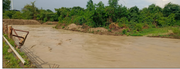
ಬೆಳೆ ಒಣಗುವ ಅಂತರ ರೈತರನ್ನು ಕಾಡುತ್ತಿತ್ತು. ಇದೀಗ ಮಂಗಳವಾರ ಸಂಜೆ ಹಾಗೂ ಬುಧವಾರ ಬೆಳಿಗ್ಗೆ ಸುರಿದ ಧಾರಾಕಾರ ಮಳೆ ರೈತಾಪಿ ವರ್ಗಕ್ಕೆ ಹೊಸ ಭರವಸೆ ನೀಡಿದೆ. ನರೇಗಲ್ಲ ಸುತ್ತಮುತ್ತಲಿನ ಉತ್ತಮ ಮಳೆಯಾಗಿದ್ದು, ತೊಂಡಿಹಾಳ ಸೇರಿದಂತೆ ವಿವಿಧ ಭಾಗಗಳಲ್ಲಿ ಮಳೆಯ ಅಭರ ಕಂಡು ಬಂದಿದೆ. ಮಳೆಯಿಂದ ನರೇಗಲ್ಲದ ಗಡ್ಡಿ ಹಳ್ಳ ತುಂಬಿ ರಭಸದಿಂದ

■ ವಿಜಯಸಾಕ್ಷಿ ಸುದ್ದಿ, ನರೇಗಲ್ಲ ಕಳೆದ ಎರಡು ದಿನಗಳಿಂದ ಸುರಿಯುತ್ತಿರುವ ರೋಹಿಣಿ ಮಳೆ ಈಗಾಗಲೇ ಬಿತ್ತನೆಯಾಗಿದ್ದ ಹೆಸರು ಹಾಗೂ ಅಲಸಂದೆ ಬೆಳೆಗೆ ಹೊಸ ಜೀವ ತುಂಬಿದ್ದು, ಮಳೆಯ ನಿರೀಕ್ಷೆಯಲ್ಲಿದ್ದ ರೈತರ ಮುಖದಲ್ಲಿ ಸಂತಸ ಮೂಡಿಸಿದೆ. ರೋಹಿಣಿ ಮಳೆ ಆರಂಭವಾದ ಬೆನ್ನಲ್ಲೇ ಅಲ್ಲ ತೇವಾಂಶದಲ್ಲೇ ರೈತರು ಹೆಸರು ಮತ್ತು ಅಲಸಂದೆ ಬಿತ್ತನೆ ಮಾಡಿದ್ದರು. ಆದರೆ ಕೆಲ ದಿನ ಮಳೆ ಕೈಕೊಟ್ಟ ಪರಿಣಾಮ