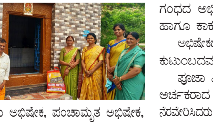
ಗಂಟೆಗೆ ಎಳನೀರು ಅಭಿಷೇಕ, ಪಂಚಾಮೃತ ಅಭಿಷೇಕ.

■ ವಿಜಯಸಾಕ್ಷಿ ಸುದ್ದಿ, ಗದಗ ಸಮೀಪದ ದಕ್ಷಿಣ ಕಾಶಿ ಖಾತಿಯ ಶ್ರೀಕ್ಷೇತ್ರ ಜಲಾಶಂಕರದಲ್ಲಿ ಪ್ರತಿಷ್ಠಾಪನೆಗೊಂಡಿರುವ ಪಾಂಡುರಂಗ, ರುಕ್ಮಿಣಿ, ಜ್ಞಾನದೇವ ಹಾಗೂ ಶುಕರಾಮರ ಮೂರ್ತಿಗಳಿಗೆ ಅಧಿಕ ಮಾರ್ಗದ ನಿಮ್ಮತ ಗುರುವಾರ ವಿಶೇಷ ಪೂಜೆ ಹಾಗೂ ಅಭಿಷೇಕ ಕಾರ್ಯಕ್ರಮ ಭಕ್ತಿಪೂರ್ವಕವಾಗಿ ನೆರವೇರಿತು. ಪ್ರತಿವರ್ಷದ ಪದ್ಧತಿಯಂತೆ ಬೆಳಿಗ್ಗೆ 6