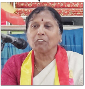
ಹೇಳಿದರು. ಅಂದಿನ ಪುಲಿಗೆರೆ, ಇಂದಿನ ಲಕ್ಷ್ಮೇಶ್ವರ, ಶೈವ, ವೈಷ್ಣವ ಹಾಗೂ ಜೈನ ಧರ್ಮಗಳ ಪ್ರಮುಖ ಕೇಂದ್ರವಾಗಿತ್ತು. ಇಲ್ಲಿ 101ಕ್ಕೂ ಹೆಚ್ಚು ಬಸದಿಗಳು ಇದ್ದವು ಎಂಬ ಉಲ್ಲೇಖ ಶಾಸನಗಳಲ್ಲಿ ದೊರೆ-ಯುತ್ತದೆ ಎಂದು ವಿವರಿಸಿದರು. ಮಹಾಕವಿರಾಜರ ಹಾಗೂ ರಾಣಿಯರು ದೇವಾಲಯಗಳು