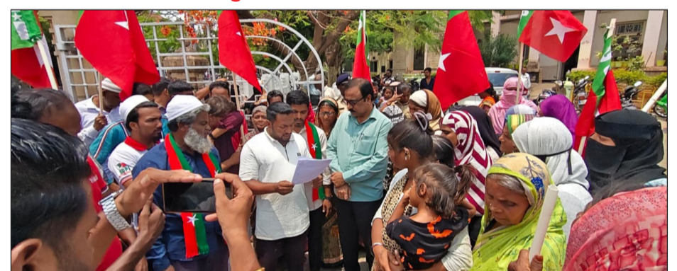
ಮನೆಗಳಿಗೆ ತುರ್ತು ದುರಸ್ತಿ ಕಾರ್ಯ ಕೈಗೊಳ್ಳಬೇಕು. ಸಾರ್ವಜನಿಕರ ಆಸ್ತಿ-ಪಾಸ್ತಿ ಹಾನಿಯನ್ನು ಸರಿಪಡಿಸಿ ಮೂಲಭೂತ ಸೌಕರ್ಯಗಳನ್ನು ತಕ್ಷಣ ಕಲ್ಪಿಸಬೇಕು ಎಂದು ಒತ್ತಾಯಿಸಲಾಯಿತು. ನಗರಾದ್ಯಂತ ಬೀದಿ ದೀಪಗಳ ಅವ್ಯವಸ್ಥೆ ಹಾಗೂ ಕಳಪೆ ಮುಟ್ಟಿದ ರಸ್ತೆಗಳ ಕಾರಣ ಜನಜೀವನ ಅಸ್ತವ್ಯಸ್ತಗೊಂಡಿದೆ. ಗದಗ-ಬೆಟಗೆರಿ ನಗರಸಭೆ ಈ ವಿಷಯಗಳನ್ನು ಗಂಭೀರವಾಗಿ ಪರಿಗಣಿಸಿ ಸಂಬಂಧಪಟ್ಟ ಇಲಾಖೆಗಳಿಂದ ತ್ವರಿತ ಕಾರ್ಯಾಚರಣೆ ನಡೆಸಬೇಕು ಎಂದು ಮನವಿ ಮುಖಾಂತರ ಆಗ್ರಹಿಸಲಾಯಿತು.

■ ವಿಜಯಸಾಕ್ಷಿ ಸುದ್ದಿ, ಗದಗ ಗದಗ-ಬೆಟಗೆರಿ ಅವಳಿ ನಗರದಲ್ಲಿ ಸಂಭವಿಸಿದ ಭಾರೀ ಬಿರುಗಾಳಿ ಸಹಿತ ಮಳೆಯಿಂದ ಅನೇಕ ಮನೆಗಳು ಹಾನಿಗೊಳಗಾಗಿದ್ದು, ಮನೆ ಕಳೆದುಕೊಂಡ ನಿರಾಶ್ರಿತ ಹಾಗೂ ಸಂತ್ರಸ್ತ ಕುಟುಂಬಗಳಿಗೆ ಖಾಯಂ ವಸತಿ ಮನೆಗಳನ್ನು ಕಲ್ಪಿಸಬೇಕು ಎಂದು ಎಸ್‌ಡಿಪಿಐ ಪಕ್ಷದ ಗದಗ ವಿಧಾನಸಭಾ ಮತಕ್ಷೇತ್ರ ಸಮಿತಿ ಆಗ್ರಹಿಸಿದೆ. ಈ ಸಂಬಂಧ ಎಸ್‌ಡಿಪಿಐ ಪಕ್ಷದ ಗದಗ ವಿಧಾನಸಭಾ ಮತಕ್ಷೇತ್ರ ಸಮಿತಿ ವತಿಯಿಂದ ಪ್ರತಿಭಟನೆ ನಡೆಸಿ, ನಗರದ ಗಾಂಧಿ ವೃತ್ತದಿಂದ ಗದಗ-ಬೆಟಗೆರಿ ನಗರಸಭೆ ಕಚೇರಿವರೆಗೆ ಪಾದಯಾತ್ರೆ ನಡೆಸಲಾಯಿತು. ಪ್ರತಿಭಟನಾಕಾರರು ನಗರಸಭೆ ಆಡಳಿತ ವ್ಯವಸ್ಥೆ ವಿರುದ್ಧ ಘೋಷಣೆ ಕೂಗಿ ತಮ್ಮ ಆಕ್ರೋಶ ವ್ಯಕ್ತಪಡಿಸಿದರು. ಬಳಿಕ ಪೌರಾಯುಕ್ತರಿಗೆ ಮನವಿ ಸಲ್ಲಿಸಿ, ಬಿರುಗಾಳಿ ಹಾಗೂ ಮಳೆಯಿಂದ ಹಾನಿಗೊಂಡ