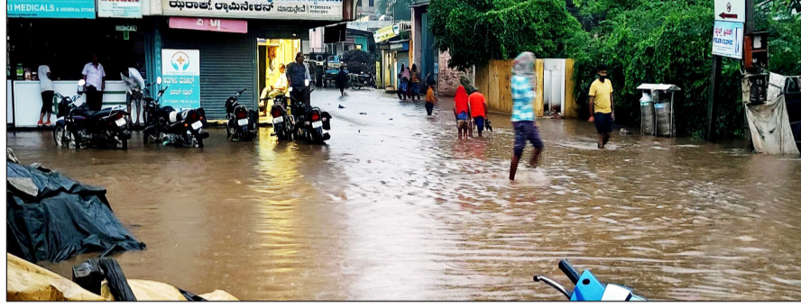
ಸಿಬ್ಬಂದಿ ಹಾಗೂ ಪೊಲೀಸರು ರಾತ್ರಿಯಿಡೀ ಕಾರ್ಯನಿರ್ವಹಿಸಿದರು. ಅವರ ಸೇವೆಗೆ ಸಾರ್ವಜನಿಕರು ಮೆಚ್ಚುಗೆ ವ್ಯಕ್ತಪಡಿಸಿದರು.

■ ವಿಜಯಸಾಕ್ಷಿ ಸುದ್ದಿ, ಲಕ್ಷ್ಮೇಶ್ವರ ಪಟ್ಟಣದಲ್ಲಿ ಗುರುವಾರ ರಾತ್ರಿ ಸುರಿದ ಭಾರಿ ಮಳೆ ಹಾಗೂ ಬಿರುಗಾಳಿಯ ಅಬ್ಬರಕ್ಕೆ ಜನಜೀವನ ಸಂಪೂರ್ಣ ಅಸ್ತವ್ಯಸ್ತಗೊಂಡಿದ್ದು, ಪಟ್ಟಣದ ಹಲವು ಪ್ರದೇಶಗಳು ಜಲಾವೃತವಾಗಿ ಜನರು ರಾತ್ರಿಯಿಡೀ ಪರದಾಟವೆಸಗುತ್ತಾ ಬಂದರು. ಮುಂಗಾರಿನ ಮೊದಲ ಮಳೆಯಲ್ಲೇ ತ್ಯಾಜ್ಯದಿಂದ ತುಂಬಿಕೊಂಡಿದ್ದ ಚರಂಡಿಗಳ ಕೊಳಚೆ ನೀರು ರಸ್ತೆಗಳಿಗೆ ಹರಿದು ಬಂದ ಪರಿಣಾಮ ರಸ್ತೆಗಳು ಕೆರೆಯಂತಾಗಿದ್ದವು. ಪಟ್ಟಣದ ಶ್ರೀಗ್ರಾಸ್, ಗ್ರಂಥಾಲಯದ ಬಳಿ ಅಪಾರ ಪ್ರಮಾಣದ ನೀರು ಹರಿದು ಬಂದು ರಸ್ತೆಗಳಲ್ಲಿ ಕೊಳಚೆ ನೀರು ತುಂಬಿಕೊಂಡಿತ್ತು. ಬಹುತೇಕ ರಸ್ತೆಗಳಲ್ಲಿ ತಗ್ಗು-ಗುಂಡಿಗಳು ನೀರಿನಿಂದ ತುಂಬಿದ್ದರಿಂದ ವಾಹನ ಸವಾರರು ಹಾಗೂ ಸಾರ್ವಜನಿಕರು ತೀವ್ರ ತೊಂದರೆ ಅನುಭವಿಸಿದರು. ಅಂಜೇಡ್ಕರ್ ನಗರ, ಮುಕ್ತಿನಗರ, ಬಸವೇಶ್ವರ ನಗರ ಸೇರಿದಂತೆ ತಗ್ಗು ಪ್ರದೇಶಗಳ ಅನೇಕ