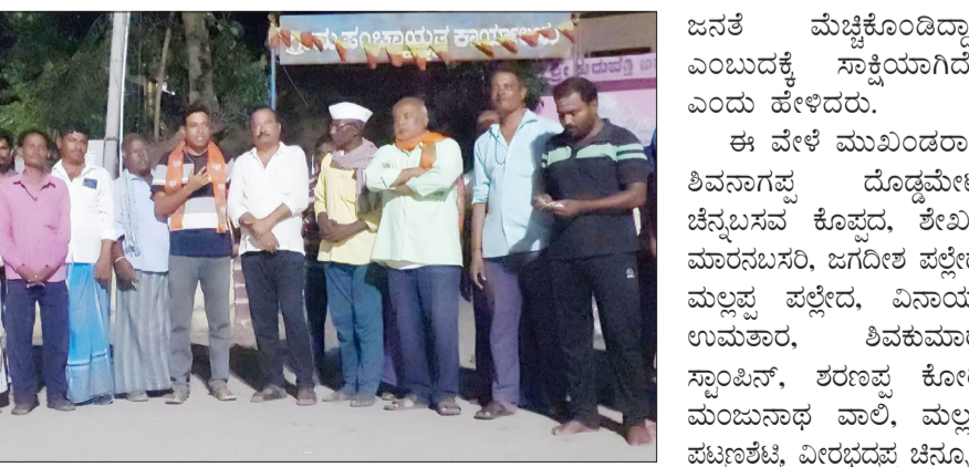
ಜನತೆ ಮೆಚ್ಚಿಕೊಂಡಿದ್ದಾರೆ ಎಂಬುದಕ್ಕೆ ಸಾಕ್ಷಿಯಾಗಿದೆ.” ಎಂದು ಹೇಳಿದರು.