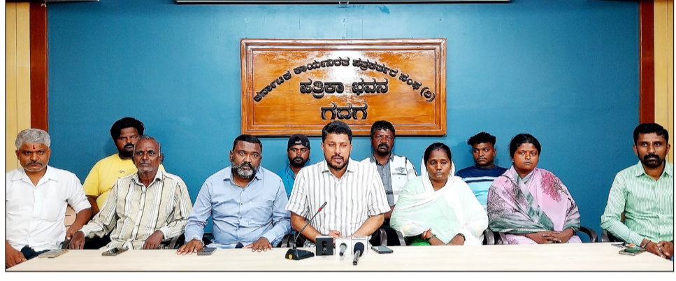
ಮೆದುರು ಉಗ್ರ ಹೋರಾಟ ನಡೆಸಲಾಗುವುದು ಎಂದು ಎಚ್ಚರಿಕೆ ನೀಡಿದರು.