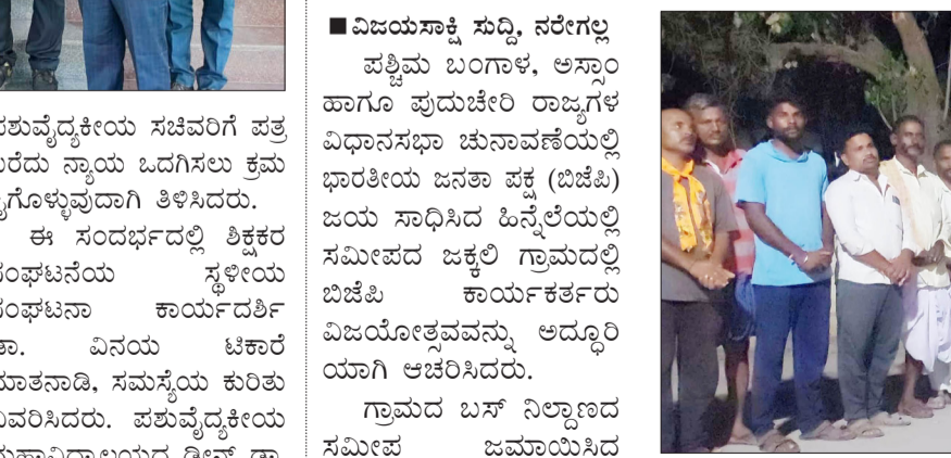
ಕೂಗಿ, ಗ್ರಾಮದಲ್ಲಿ ವಿಜಯೋತ್ಸವದ ವಾತಾವರಣ ಸೃಷ್ಟಿಸಿದರು.