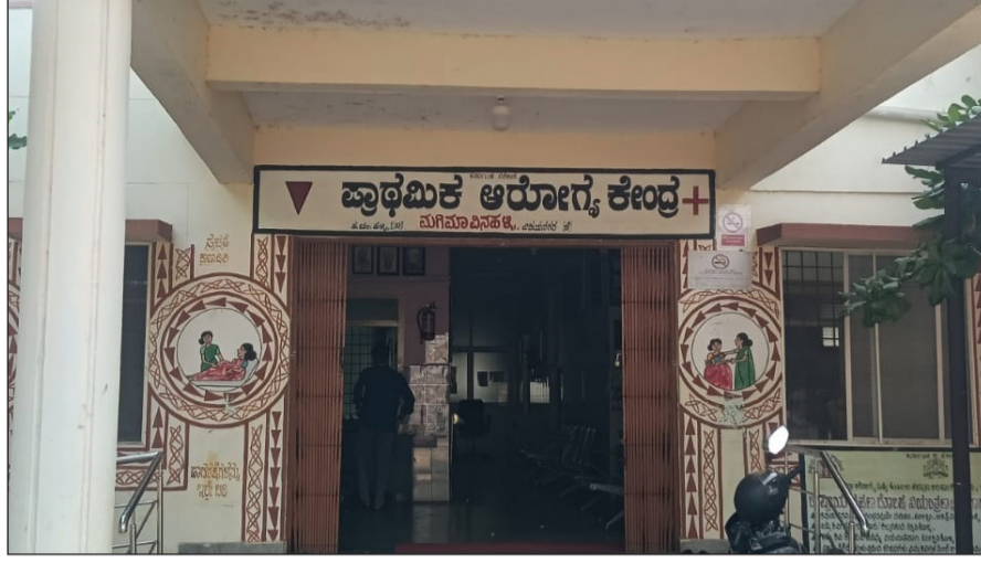
(ಏಡ್ಯುಟ್ ಬ್ಯಾಟರಿ) ಅಳವಡಿಕೆ ಮಾಡಿರುವುದರಿಂದ

ಈ ಆರೋಗ್ಯ ಕೇಂದ್ರವು ಸುತ್ತಮುತ್ತಲಿನ ಗ್ರಾಮಗಳಿಗೆ ಮಧ್ಯ ಕೇಂದ್ರವಾಗಿದ್ದು, ಸಂಜೆ 6ರಿಂದ 8 ಗಂಟೆಯವರೆಗೆ ಬರುವ ರೋಗಿಗಳು ಚಿಕಿತ್ಸೆಗಾಗಿ ಕಾಯುವ ಪರಿಸ್ಥಿತಿ ನಿರ್ಮಾಣವಾಗುತ್ತಿದೆ. ಬಳಿಕ ಬರುವ ಸಿಬ್ಬಂದಿ ಹಾಗೂ ನರ್ಸ್‌ಗಳು ಡ್ಯೂಟಿ ಡೆಸ್ ಇಲ್ಲದ ಸಾಮಾನ್ಯ ಉಡುಪಿನಲ್ಲಿ ಸೇವೆಗೆ ಬರುತ್ತಿರುವುದರಿಂದ ಸೋಂಕು ಹರಡುವ ಭೀತಿ ಇದೆ ಎಂದು ಜನರು ಆತಂಕ ವ್ಯಕ್ತಪಡಿಸಿದ್ದಾರೆ. ಆಸ್ಪತ್ರೆಯ ಡ್ರೈನಿಂಗ್ ರೂಮ್‌ನಲ್ಲಿ ಯುಪಿಸಿಎಫ್ (ಏಡ್ಯುಟ್ ಬ್ಯಾಟರಿ) ಅಳವಡಿಕೆ ಮಾಡಿರುವುದರಿಂದ