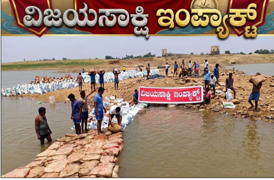
■ ವಿಜಯಸಾಕ್ಷಿ ಸುದ್ದಿ, ಹರಿಬೊಮ್ಮನಹಳ್ಳಿ ತುಂಗಭದ್ರಾ ನದಿಯಲ್ಲಿ ನೀರಿನ ಸಂಕಷ್ಟಕ್ಕೆ ಅಧಿಕಾರಿಗಳು ನೀರಿನ ಮಟ್ಟ ತೀವ್ರವಾಗಿ ಕುಸಿದ

ಸ್ಥಳೀಯ ಮಟ್ಟದಲ್ಲಿ ನೀರಿನ ಲಭ್ಯತೆ ಹೆಚ್ಚಿಸಲಾಗಿದೆ. ಇತ್ತೀಚೆಗೆ "ಬರಿದಾದ ತುಂಗಭದ್ರಾ ನೀರಿಗಾಗಿ ಹಾಹಾಕಾರ" ಎಂಬ ಶೀರ್ಷಿಕೆಯಲ್ಲಿ ಪ್ರಕಟವಾದ ವಿಜಯ ಸಾಕ್ಷಿ ವರದಿಗೆ ಸ್ಪಂದನ ವ್ಯಕ್ತವಾಗಿದ್ದು, ಅಧಿಕಾರಿಗಳ ಈ ತ್ವರಿತ ಕ್ರಮವನ್ನು ಸ್ಥಳೀಯ ವಿಜಯಸಾಕ್ಷಿ ಇಂಪ್ಯಾಕ್ಟ್ ಎಂದು ಪ್ರಶಂಸಿಸಿದ್ದಾರೆ. ತುಂಗಭದ್ರಾ ನದಿಯಲ್ಲಿ ನೀರಿನ ಮಟ್ಟ ಕುಸಿತದಿಂದ ಜಾಕ್ವಾಲ್‌ಗಳು ಕಾರ್ಯನಿರ್ವಹಿಸದ ಬನ್ನಿಗೋಳ ಸೇರಿದಂತೆ ಹಲವು ಗ್ರಾಮಗಳಲ್ಲಿ ಮೋಟಾರ್‌ಗಳು ಸ್ಥಗಿತಗೊಂಡಿದ್ದವು. ಹಗಿಬೊಮ್ಮನಹಳ್ಳಿ ಪಟ್ಟಣದಲ್ಲಿಯೂ ಕುಡಿಯುವ ನೀರಿನ ತೀವ್ರ ಅಭಾವದಿಂದ ಜನರು ಸಂಕಷ್ಟ ಅನುಭವಿಸುತ್ತಿದ್ದರು. ಈ ತಾತ್ಕಾಲಿಕ ಕ್ರಮದಿಂದ ಕೆಲವೊಂದು ಭಾಗಗಳಲ್ಲಿ ನೀರಿನ ಸರಬರಾಜು ಪುನಃ