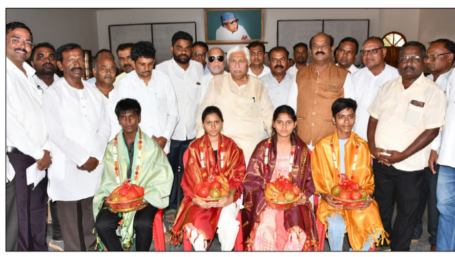
ವಿದ್ಯಾರ್ಥಿಗಳಿಗೆ ಆಯೋಜಿಸಿದ ವಿನ್‌ಎನ್‌ಎಲ್‌ಸಿ ಸನ್ಮಾನ ಕಾರ್ಯಕ್ರಮದಲ್ಲಿ ಅವರು ಮಾತನಾಡಿದರು. ಬಡತನವನ್ನು ನೆಪ ಮಾಡದ ಪ್ರತಿಯೊಬ್ಬ ವಿದ್ಯಾರ್ಥಿಯೂ ಶಿಕ್ಷಣದಲ್ಲಿ ಮುನ್ನಡೆಯಬೇಕು. ಯಶಸ್ಸು ಸಾಧಿಸಬೇಕು ಎಂದು ಕರೆ ನೀಡಿದರು. ಗದಗ ಜಿಲ್ಲೆಯ ಮಕ್ಕಳು ಇನ್ನಷ್ಟು ಸಾಧನೆ ಮಾಡಿ ಉನ್ನತ ಹುದ್ದೆಗಳನ್ನು