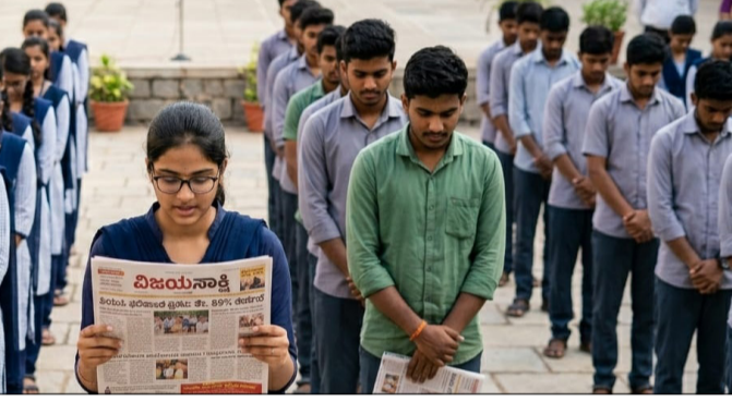
ಡಿಜಿಟಲ್ ಯುಗದ ಸವಾಲು: ಇಂದಿನ ದಿನಗಳಲ್ಲಿ ಮಕ್ಕಳು ಇಂಟರ್‌ನೆಟ್, ಮೊಬೈಲ್ ಹಾಗೂ ಹೆಚ್ಚಿನ ಸಮಯ ಕಳೆಯುತ್ತಿದ್ದಾರೆ. ಇಂದಿನ ದಿನಗಳಲ್ಲಿ ಮಕ್ಕಳು ಸಾಮಾಜಿಕ ಜಾಲತಾಣಗಳಲ್ಲಿ ಇದ್ದರ ಪರಿಣಾಮವಾಗಿ ಜ್ಞಾಪಕಶಕ್ತಿ ಕುಗ್ಗುವುದು, ದೈಹಿಕ ಚಟುವಟಿಕೆಗಳಲ್ಲಿ ಆಸಕ್ತಿ ಕಡಿಮೆಯಾಗುವುದು ಹಾಗೂ ಮಾನಸಿಕ ಸಮಸ್ಯೆಗಳು ಹೆಚ್ಚುತ್ತಿರುವುದು ಕಂಡುಬರುತ್ತಿದೆ.