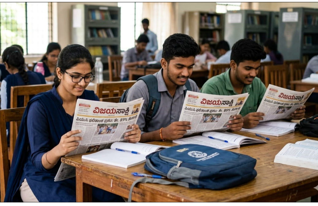
ಇಂಟರ್‌ನೆಟ್, ಮೊಬೈಲ್ ಹಾಗೂ ಹೆಚ್ಚಿನ ಸಮಯ ಕಳೆಯುತ್ತಿದ್ದಾರೆ. ಇಂದಿನ ದಿನಗಳಲ್ಲಿ ಮಕ್ಕಳು ಸಾಮಾಜಿಕ ಜಾಲತಾಣಗಳಲ್ಲಿ ಇದ್ದರ ಪರಿಣಾಮವಾಗಿ ಜ್ಞಾಪಕಶಕ್ತಿ ಕುಗ್ಗುವುದು, ದೈಹಿಕ ಚಟುವಟಿಕೆಗಳಲ್ಲಿ ಆಸಕ್ತಿ ಕಡಿಮೆಯಾಗುವುದು ಹಾಗೂ ಮಾನಸಿಕ ಸಮಸ್ಯೆಗಳು ಹೆಚ್ಚುತ್ತಿರುವುದು ಕಂಡುಬರುತ್ತಿದೆ.

ಇಂದಿನ ಡಿಜಿಟಲ್ ಯುಗದಲ್ಲಿ ಸ್ಮಾರ್ಟ್ಫೋನ್, ಟ್ಯಾಬ್ಲೆಟ್ ಹಾಗೂ ಕಂಪ್ಯೂಟರ್‌ಗಳ ಬಳಕೆ ಹೆಚ್ಚುತ್ತಿರುವುದರಿಂದ ಮಕ್ಕಳ ಓದುವ ಅಭ್ಯಾಸ ಕುಗ್ಗುತ್ತಿರುವುದು ಗಮನಾರ್ಹವಾಗಿದೆ. ಈ ಹಿನ್ನೆಲೆಯಲ್ಲಿ ಕರ್ನಾಟಕ ರಾಜ್ಯದ ಎಲ್ಲಾ ಸರ್ಕಾರಿ, ಅನುದಾನಿತ ಹಾಗೂ ಅನುದಾನ ರಹಿತ ಶಾಲೆಗಳಲ್ಲಿ ಪ್ರತಿದಿನ ಬೆಳಿಗಿನ ಪ್ರಾರ್ಥನೆಯ ನಂತರ ಕನಿಷ್ಠ 10 ನಿಮಿಷಗಳ ಕಾಲ ಕನ್ನಡ ದಿನಪತ್ರಿಕೆ ಓದುವ ಅಭ್ಯಾಸವನ್ನು ಕಡ್ಡಾಯಗೊಳಿಸುವ ಮಹತ್ವದ ಕ್ರಮ ಕೈಗೊಳ್ಳಲಾಗಿದೆ.