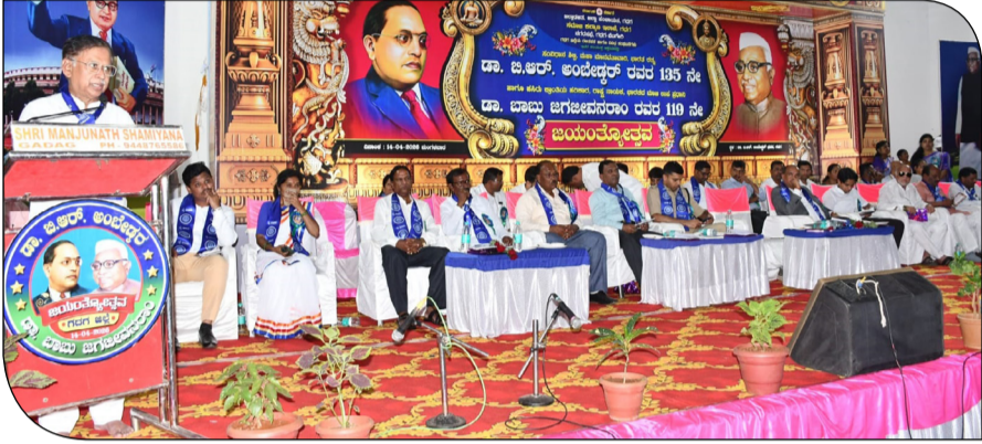
■ ವಿಜಯಸಾಕ್ಷಿ ಸುದ್ದಿ, ಗದಗ