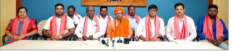
■ ವಿಜಯಸಾಕ್ಷಿ ಸುದ್ದಿ, ಗದಗ