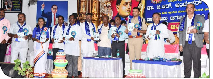
■ ವಿಜಯಸಾಕ್ಷಿ ಸುದ್ದಿ, ಗದಗ