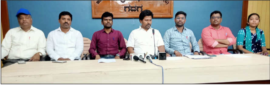
■ ವಿಜಯಸಾಕ್ಷಿ ಸುದ್ದಿ, ಗದಗ

ಕಳೆದ 15 ವರ್ಷಗಳಿಂದ ಪಾಲಿಟೆಕ್ನಿಕ್ ಕಾಲೇಜುಗಳಲ್ಲಿ ಅತಿಥಿ ಉಪನ್ಯಾಸಕರಾಗಿ ಸೇವೆ ಸಲ್ಲಿಸುತ್ತಿರುವ ನಮಗೆ ಸರ್ಕಾರದ ಹೊಸ ನೇಮಕಾತಿ ನಿರ್ಧಾರದಿಂದ ಅನ್ಯಾಯವಾಗುತ್ತಿದೆ. ಈ ಹಿನ್ನೆಲೆಯಲ್ಲಿ ಇಂದು ಬೆಂಗಳೂರಿನ ಪ್ರೀಡಂ ಪಾರ್ಕ್ ನಲ್ಲಿ ಒಂದು ದಿನದ ಧರಣಿ ಸತ್ಯಾಗ್ರಹ ಹಮ್ಮಿಕೊಳ್ಳಲಾಗಿದೆ ಎಂದು ಅಖಿಲ ಕರ್ನಾಟಕ ಸರ್ಕಾರಿ