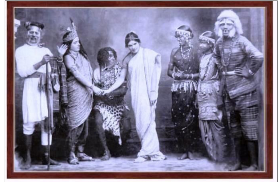
'ಚವತಿ ಚಂದ್ರ' ನಾಟಕ - ಶ್ರೀ ದತ್ತಾತ್ರೇಯ ಸಂಗೀತ ನಾಟಕ ಮಂಡಳಿ, ಗದಗ (ರಂಗಿ)

ಈ ಬಾರಿ ವಿಶೇಷ ಆಕರ್ಷಣೆಯಾಗಿ, ಗದುಗಿನ ಪ್ರಸಿದ್ಧ