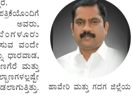
ಹಾವೇರಿ ಮತ್ತು ಗದಗ ಜಿಲ್ಲೆಯ ಬುದ್ಧವಾರ ಪತ್ರಿಕೆಯೊಂದಿಗೆ ಮಾತನಾಡಿದ ಅವರು, ಧಾರವಾಡ-ಬೆಂಗಳೂರು ಮಧ್ಯೆ ಸಂಚರಿಸುವ ವಂದೇ ಭಾರತ್ ರೈಲನ್ನು ಧಾರವಾಡ, ಹುಬ್ಬಳ್ಳಿ, ದಾವಣಗೆರೆ ಮತ್ತು ತುಮಕೂರು ನಿಲ್ದಾಣಗಳಲ್ಲಷ್ಟೇ ನಿಲುಗಡೆ ಮಾಡಲಾಗುತ್ತಿತ್ತು.