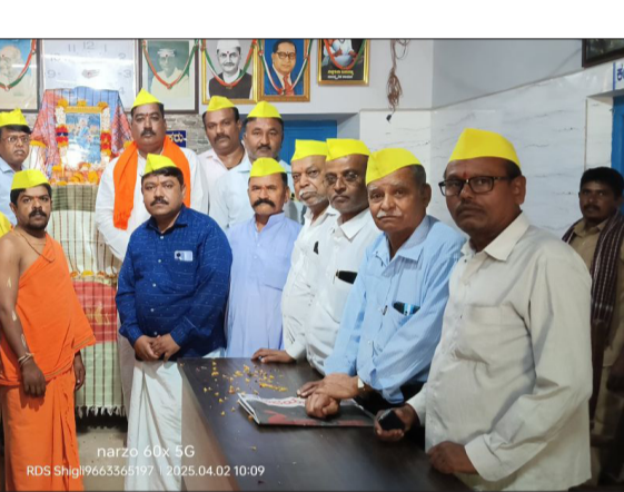
ಕೇವಲ ಒಂದು ಜಾತಿ, ಜನಾಂಗಕ್ಕೆ ಸೀಮಿತಗೊಳಿಸದೇ ಅವರ ವಚನಗಳಲ್ಲಿನ ಸಾರವನ್ನು ನಮ್ಮ ಜೀವನದಲ್ಲಿ ಅಳವಡಿಸಿಕೊಳ್ಳಬೇಕು ಎಂದು ಈ ಸಂದರ್ಭದಲ್ಲಿ ಹಿರಿಯರು ಉಪಸ್ಥಿತರಿದ್ದರು.