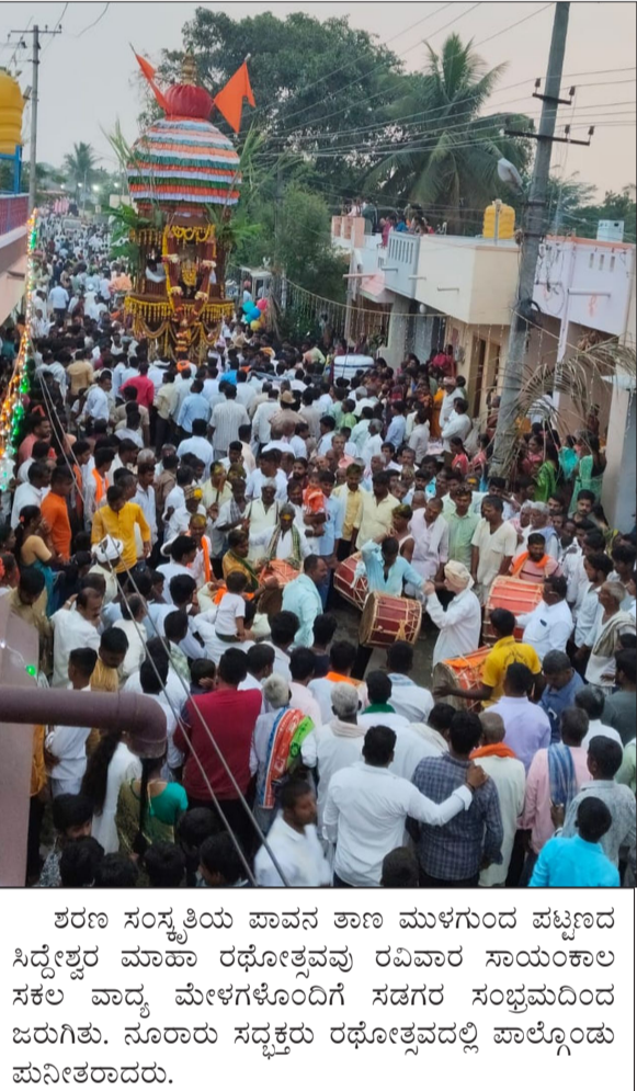
ಶರಣ ಸಂಸ್ಕೃತಿಯ ಪಾವನ ತಾಣ ಮುಳಗುಂದ ಪಟ್ಟಣದ ಸಿದ್ದೇಶ್ವರ ಮಾಹಾ ರಥೋತ್ಸವವು ರವಿವಾರ ಸಾಯಂಕಾಲ ಸಕಲ ವಾದ್ಯ ಮೇಳಗಳೊಂದಿಗೆ ಸಡಗರ ಸಂಭ್ರಮದಿಂದ ಜರುಗಿತು. ನೂರಾರು ಸದ್ಭಕ್ತರು ರಥೋತ್ಸವದಲ್ಲಿ ಪಾಲ್ಗೊಂಡು ಪುನೀತರಾದರು.

■ ವಿಜಯಸಾಕ್ಷಿ ಸುದ್ದಿ, ಛತ್ತೀಸ್‌ಗಢ ಛತ್ತೀಸ್‌ಗಢದ ದಂತೇವಾಡದಲ್ಲಿ ನಡೆದ ಏನ್‌ಕೌಂಟರ್‌ನಲ್ಲಿ ದಂಡಕಾರಣ್ಯ ವಿಶೇಷ ವಲಯ ಸಮಿತಿಯ ಮಹಿಳಾ ಸದಸ್ಯೆ ಮತ್ತು ಇತರ ಹಲವಾರು ಮಾವೋವಾದಿಗಳು ಸಾವನ್ನಪ್ಪಿದ್ದಾರೆ.