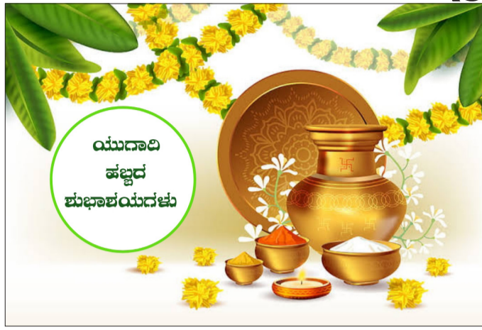
ಯುಗಾದಿ ಹಬ್ಬದ ಪುನರ್ಭವನ