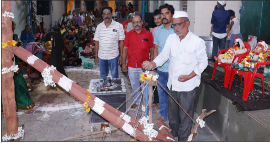
ಗದಗಿನ ಶ್ರೀ ಕಟ್ಟಿ ಬಸವೇಶ್ವರ ಸಮುದಾಯ ಭವನ ಟ್ರಸ್ಟ್ ಹಾಗೂ ಶ್ರೀ ಕಟ್ಟಿ ಬಸವೇಶ್ವರದೇವಸ್ಥಾನ ಸಹಯೋಗದಲ್ಲಿ ನಡೆಯುತ್ತಿರುವ ಶ್ರೀ ಮಹಾದಾಸೋಟ ಕಲಬುರ್ಗಿ ಶರಣ ಬಸವೇಶ್ವರರ 47ನೇ ವರ್ಷದ ಪುರಾಣ ಮಹೋತ್ಸವ ಧಾರ್ಮಿಕ ಸಮಾರಂಭದಲ್ಲಿ ಮಂಗಳವಾರ ಶ್ರೀ ಶರಣ ಬಸವೇಶ್ವರರ ಶಾಶ್ವತ ಕಾರ್ಯಕ್ರಮವನ್ನು ಸದ್ಭಕ್ತರು ಕಣ್ಮುಚ್ಚಿಕೊಂಡು ಶರಣ ಬಸವೇಶ್ವರರ ಕೃಪೆಗೆ ಪಾತ್ರರಾದರು.

ಸಹಿ/- ಕಾರ್ಯದರ್ಶಿ ಕೃಷಿ ಉತ್ಪನ್ನ ಮಾರುಕಟ್ಟೆ ಸಮಿತಿ ಗದಗ ಸಹಿ/- ಅಧ್ಯಕ್ಷರು ಕೃಷಿ ಉತ್ಪನ್ನ ಮಾರುಕಟ್ಟೆ ಸಮಿತಿ ಗದಗ