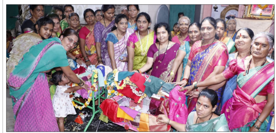
■ ವಿಜಯನಾಕ್ಕೆ ಸುದ್ದಿ, ಗದಗ

ಶ್ರೀ ಕಟ್ಟಿ ಬಸವೇಶ್ವರ ಸಮುದಾಯ ಭವನ ಟ್ರಸ್ಟ್ ಹಾಗೂ ಶ್ರೀ ಕಟ್ಟಿ ಬಸವೇಶ್ವರ ದೇವಸ್ಥಾನದ ಸಹಯೋಗದಲ್ಲಿ ಮಾರ್ಚ್ 16ರಿಂದ 30ರವರೆಗೆ ಶ್ರೀ ಮಹಾದಾಸೋಹಿ ಕಲಬುರಗಿ ಶರಣ ಬಸವೇಶ್ವರ 47ನೇ ವರ್ಷದ ಪುರಾಣ ಪ್ರಾರಂಭೋತ್ಸವ ಧಾರ್ಮಿಕ ಸಮಾರಂಭ ಹಮ್ಮಿಕೊಂಡಿದ್ದು, ಇದರ ಅಂಗವಾಗಿ ಶ್ರೀ ಶರಣ