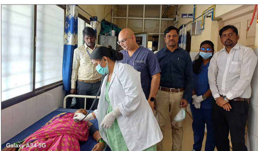
ದೀರ್ಘಕಾಲದಿಂದ ಮಾಯದ ಹುಣ್ಣು ಗಡ್ಡೆಯಲ್ಲಿ ತ್ವರಿತ ಬೆಳವಣಿಗೆ, ಧ್ವನಿಯಲ್ಲಿ ಬದಲಾವಣೆ, ನುಂಗಲು ತೊಂದರೆ, ತೀವ್ರ ನೋವು, ಸುಸ್ತು ಹೀಗೆ ಕ್ಯಾನ್ಸರ್ ರೋಗದ ಲಕ್ಷಣಗಳು ಇರುತ್ತವೆ. ಅವುಗಳನ್ನು ಪ್ರಾರಂಭದಲ್ಲಿ ಗುರುತಿಸಿ ಚಿಕಿತ್ಸೆ ಪಡೆಯಬೇಕು. ರೋಗಿಗಳ ಸಂಭಾಷಣೆಯ ಗೌಪ್ಯವಾಗಿ ಇಡಲಾಗುವುದು. ಕ್ಯಾನ್ಸರ್ ರೋಗಕ್ಕೆ ಭಯ ಪಡುವ ಅಗತ್ಯವಿಲ್ಲ, ರೋಗಿಗಳು ಆತ್ಮಸ್ಥೈರ್ಯದೊಂದಿಗೆ