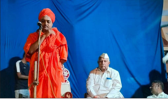
ದೀಪೋತ್ಸವ ಕಾರ್ಯಕ್ರಮದ ನಿರೀಡಿದರು. ಸಾನ್ನಿಧ್ಯ ವಹಿಸಿ ಆಶೀರ್ವಚನ ಮನೆ ಬೆಳಗಲು ಭೌತಿಕ