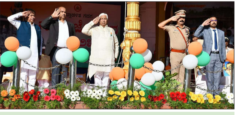
ಮುಖ್ಯಮಂತ್ರಿ ಸಿದ್ದರಾಮಯ್ಯ ಅವರು ಅಭಿವೃದ್ಧಿಯ ಹರಿಕಾರರು ಹಾಗೂ ಹೆಸರು ಮುಕ್ತ ಕರ್ನಾಟಕ ಮಾಡಿದ ಮುಖ್ಯಮಂತ್ರಿ ಜಿಲ್ಲೆಯ ಅಭಿವೃದ್ಧಿಗೆ ಸಹಕಾರ ನೀಡಿದ್ದು, ದಿನಾಂಕ 15.12.2024ರಂದು ಜಿಲ್ಲೆಯ ರೋಣಕ್ಕೆ ಆಗಮಿಸಿ, ರೋಣ ವಿಧಾನ ಸಭಾ ಕ್ಷೇತ್ರ ವ್ಯಾಪ್ತಿಯಲ್ಲಿ 19689.97 ಲಕ್ಷ ರೂ. ವೆಚ್ಚದಲ್ಲಿ 11 ಕಾಮಗಾರಿಗಳ ಶಂಕು ಸ್ಥಾಪನೆಗಳನ್ನು ಹಾಗೂ 5 ಕಾಮಗಾರಿಗಳ ಉದ್ಘಾಟನೆ ಸೇರಿದಂತೆ ಒಟ್ಟು 16 ಕಾಮಗಾರಿಗಳಿಗೆ ಚಾಲನೆ ನೀಡುವ ಮೂಲಕ ಅಭಿವೃದ್ಧಿಯ ದಾಪುಗಳನ್ನು ಇಡಲಾಗಿದೆ ಎಂದು ಸಚಿವ ಎಚ್.ಕೆ. ಪಾಟೀಲ ತಿಳಿಸಿದರು.

■ ವಿಜಯಸಾಕ್ಷಿ ಸುದ್ದಿ, ಗದಗ ಭಾರತೀಯ ಪ್ರಜೆಗಳಾದ ನಾವು ಭಾರತವನ್ನು ಒಂದು ಸಾರ್ವಭೌಮ, ಸಮಾಜವಾದಿ, ಜ್ಯೋತಿಸ್ವಾತಂತ್ರ್ಯ, ಪ್ರಜಾಸತ್ತಾತ್ಮಕ ಗಣತಂತ್ರವನ್ನಾಗಿ ವಿಧಿಯುಕ್ತವಾಗಿ ಸ್ಥಾಪಿಸಿದ್ದೇವೆ. ಸಾಮಾಜಿಕ ನ್ಯಾಯವನ್ನು ರಾಷ್ಟ್ರದ ಎಲ್ಲಾ ಪ್ರಜೆಗಳಿಗೆ ಒದಗಿಸುವ ಸಂವಿಧಾನ ನಮ್ಮದು ಎಂದು ಜಿಲ್ಲಾ ಉಸ್ತುವಾರಿ ಸಚಿವ ಎಚ್.ಕೆ. ಪಾಟೀಲ ಹೇಳಿದರು. ನಗರದ ಕೆ.ಎಚ್. ಪಾಟೀಲ ಜಿಲ್ಲಾ ಕ್ರೀಡಾಂಗಣದಲ್ಲಿ ಜಿಲ್ಲಾಡಳಿತದಿಂದ ರವಿವಾರ ಜರುಗಿದ ಗಣರಾಜ್ಯೋತ್ಸವ ದಿನಾಚರಣೆಯ ಸಾರ್ವಜನಿಕ ದ್ವಜಾರೋಹಣ ನೆರವೇರಿಸಿ ಅವರು ಮಾತನಾಡಿದರು. ನಮ್ಮ ದೇಶ ಪ್ರಪಂಚದಲ್ಲಿಯೇ ಅತಿದೊಡ್ಡ ಪ್ರಜಾಸತ್ತಾತ್ಮಕವಾದ ಆಡಳಿತವನ್ನು ಹೊಂದಿದ ಗಣರಾಜ್ಯವಾಗಿದ್ದು, ಜನರಿಂದ-ಜನರಿಗಾಗಿ ಆಡಳಿತ ಪ್ರಜಾಸತ್ತಾತ್ಮಕ ವ್ಯವಸ್ಥೆಯ ಧ್ಯೇಯ