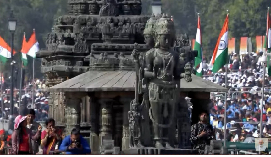
ಪಥಸಂಚಲನದಲ್ಲಿ ಪಾಲ್ಗೊಳ್ಳುವ ಗಮನ ಸೆಳೆಯುತ್ತಿದೆ. ನಮ್ಮ ರಾಜ್ಯವು ವರ್ಷದಿಂದ ವರ್ಷಕ್ಕೆ ಹೊಸ ಮೈಲಿಗಲ್ಲನ್ನು ಸ್ಥಾಪಿಸುತ್ತಲೇ ಸಾಗಿದ್ದು, ಈ ಬಾರಿ ಲಕ್ಷುಂಡಿ-ಯ ಶಿಲ್ಪಕಲೆಯಿಂದ ಕೂಡಿರುವ ಪಥಸಂಚಲನದಲ್ಲಿ ಪಾಲ್ಗೊಳ್ಳುವ ಗಮನ ಸೆಳೆಯುತ್ತಿದೆ. ನಮ್ಮ ರಾಜ್ಯವು ವರ್ಷದಿಂದ ವರ್ಷಕ್ಕೆ ಹೊಸ ಮೈಲಿಗಲ್ಲನ್ನು ಸ್ಥಾಪಿಸುತ್ತಲೇ ಸಾಗಿದ್ದು, ಈ ಬಾರಿ ಲಕ್ಷುಂಡಿ-ಯ ಶಿಲ್ಪಕಲೆಯಿಂದ ಕೂಡಿರುವ

■ ವಿಜಯಸಾಕ್ಷಿ ಸುದ್ದಿ, ನವದೆಹಲಿ ರಾಷ್ಟ್ರದ ರಾಜಧಾನಿ ನವದೆಹಲಿಯ ಕರ್ತವ್ಯಪಥದಲ್ಲಿ ಭಾನುವಾರ ನಡೆದ ಗಣರಾಜ್ಯೋತ್ಸವ ಸ್ವಚ್ಛಿತ್ತ ಪಥಸಂಚಲನದಲ್ಲಿ ಸರ್ವ ಜನಾಂಗದ ಶಾಂತಿಯ ತೋಟದಂತೆ ಕಂಗೊಳಿಸುತ್ತಿರುವ 'ಲಕ್ಷುಂಡಿ: ಶಿಲ್ಪಕಲೆಯ ತೋಟ' ರಾಜ್ಯದ ಸ್ವಚ್ಛಿತ್ತವು ಅಲ್ಲಿ ನೆರೆದ ಜನಸಮೂಹವನ್ನು ಮಂತ್ರಮುಗ್ಧರನ್ನಾಗಿಸಿದ್ದಲ್ಲದೇ, ಕರತಾದನದ ಮೂಲಕ ಅದ್ಭೂತಿ ಸ್ವಾಗತ ದೊರೆಯಿತು.ರಾಜಧಾನಿಯ ಕರ್ತವ್ಯಪಥದಲ್ಲಿ ರಾಜ್ಯದ ಸ್ವಚ್ಛಿತ್ತವು ಹಿರಿಮೆ, ಸರ್ವಧರ್ಮ ಸಮನ್ವಯ, ಶಾಂತಿ-ಸಹಬಾಳ್ವೆಯನ್ನು ಪ್ರತಿಪಾದಿಸಿತು. ಕರ್ನಾಟಕ ರಾಜ್ಯದ ಪರವಾಗಿ ಗಣರಾಜ್ಯೋತ್ಸವದ