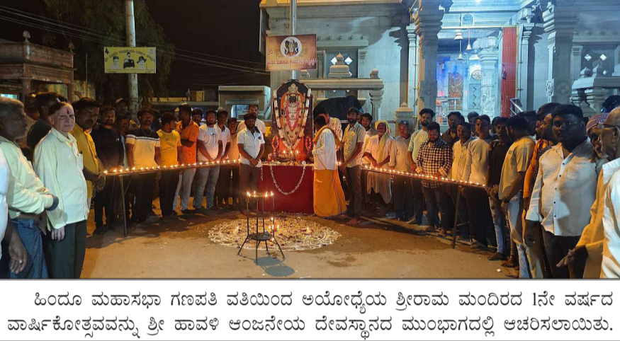
ಹಿಂದೂ ಮಹಾಭಾಷಾ ಗಣಪತಿ ವತಿಯಿಂದ ಆಯೋಜಿಸಿದ ಶ್ರೀರಾಮ ಮಂದಿರದ 1ನೇ ವರ್ಷದ ವಾರ್ಷಿಕೋತ್ಸವವನ್ನು ಶ್ರೀ ಹಾವಳಿ ಆಂಜನೇಯ ದೇವಸ್ಥಾನದ ಮುಂಭಾಗದಲ್ಲಿ ಆಚರಿಸಲಾಯಿತು.

ಕಾರ್ಯಕ್ರಮದ ಅಧ್ಯಕ್ಷತೆಯನ್ನು ವಹಿಸಿ ಮಾತನಾಡಿ ಮನುಷ್ಯನ ವ್ಯಕ್ತಿತ್ವ ವಿಕಸನಕ್ಕೆ ಶಿಕ್ಷಣವೇ ಭದ್ರಬುನಾದಿಯಾಗಿದೆ ಇದು ಮನೆ ಹಾಗೂ ಸಮುದಾಯ ಹಂತದಲ್ಲಿ ಸುಭದ್ರವಾಗಿ ನಿರ್ಮಿಸಿದಾಗ ಎಲ್ಲರ ಭವಿಷ್ಯ ಉತ್ತಮವಾಗುತ್ತದೆ ಎಂದರು.