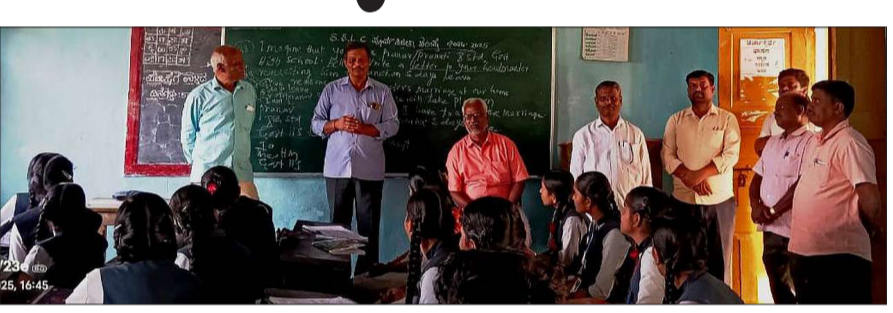
ನಂತರ ಅವರು ಮಾತನಾಡಿದರು. ಓದು ಭಾಷೆ ಶುದ್ಧವಾಗಿರಬೇಕು, ಸ್ಥುಟವಾಗಿರಬೇಕು. ಹಾಗೆಯೇ ಬರೆಯುವುದೂ ಕೂಡ ಶುದ್ಧವಾಗಿ, ಸ್ಪಷ್ಟವಾಗಿ, ತಪ್ಪಿಲ್ಲದಂತೆ, ಅಂದವಾಗಿ ಬರೆಯುವುದನ್ನು ನಿಮ್ಮ ರೂಢಿಸಿಕೊಂಡರೆ ಭವಿಷ್ಯದಲ್ಲಿ ಉತ್ತಮ ವ್ಯಕ್ತಿಗಳಾಗುತ್ತೀರಿ ಎಂದು. ನಿಮ್ಮ ಬರವಣಿಗೆಯೇ ನಿಮಗೆ ಮುಂಬರುವ ಪರೀಕ್ಷೆಯಲ್ಲಿ ಅಂಕಗಳನ್ನು ತಂದು ಕೊಡುತ್ತದೆ. ನಿಮ್ಮ ಉತ್ತರ ಪತ್ರಿಕೆಯನ್ನು ನೋಡಿದ ತಕ್ಷಣ ಹೌದನ್ನುಂಂತೆ ಇರಬೇಕು. ಆ ರೀತಿಯ ಬರವಣಿಗೆ ನಿಮ್ಮದಾಗಬೇಕು. ನಿಮ್ಮ ಮನಸ್ಸು ಎಂದಿಗೂ ಚಂಚಲವಾಗಬಾರದು. ಏಕನಿಷ್ಠೆಯಿಂದ ಅಭ್ಯಾಸದ ಕಡೆಗೆ ಗಮನ ನೀಡಬೇಕು. ಇನ್ನೆರಡು ತಿಂಗಳು ಇಷ್ಟಪಟ್ಟು ಓದಿ ನಿಮ್ಮ ಜೀವನಕ್ಕೆ ಭದ್ರ ಬುನಾದಿಯನ್ನು