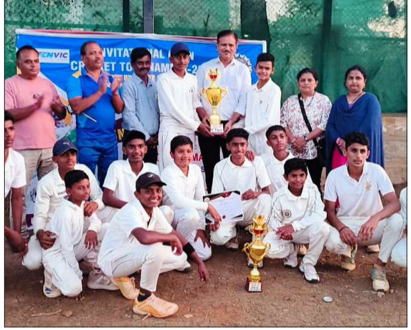
ಜಾನೋಪಂತರ ಕ್ರಿಕೆಟ್ ಅಕಾಡೆಮಿ ಪ್ರಶಸ್ತಿಯನ್ನು ಸೋಲಿಸಿ ತಂಡವು ಹುಬ್ಬಳ್ಳಿಯ ಕೆ.ಎಲ್.ಇ. ಪ್ರಶಸ್ತಿಯನ್ನು ಗೆದ್ದುಕೊಂಡಿತು.

ವಿಜಯಸಾಕ್ಷಿ ಸುದ್ದಿ, ಗದಗ ಇತ್ತೀಚೆಗೆ ಹುಬ್ಬಳ್ಳಿಯ ಬಿ.ಜಿ ಮೈದಾನದಲ್ಲಿ ಆಹ್ವಾನಿತ ತಂಡಗಳಾಗಿ ನಡೆದ 16 ವರ್ಷದೊಳಗಿನ ಕ್ರಿಕೆಟ್ ಟೂರ್ನಿಯಲ್ಲಿ ಗದಗಿನ ಜಾನೋಪಂತರ ಕ್ರಿಕೆಟ್ ಅಕಾಡೆಮಿ ತಂಡವು ಪ್ರಶಸ್ತಿಯನ್ನು ಗೆದ್ದುಕೊಂಡಿದೆ. ಈ ಟೂರ್ನಿಯನ್ನು ಹುಬ್ಬಳ್ಳಿಯ ಶ್ರೀ ಸಿದ್ಧಾರೂಢಸ್ವಾಮಿ ಸ್ಪೋರ್ಟ್ಸ್ ಕ್ಲಬ್ ಆಯೋಜಿಸಿತ್ತು. ಹುಬ್ಬಳ್ಳಿ-ಧಾರವಾಡ, ಗದಗ, ಅಂಕಲಿ, ಹಾವೇರಿ ಹಾಗೂ ರಾಣೇಬೆನ್ನೂರಿನ ಒಟ್ಟು 8 ತಂಡಗಳು ಈ ಟೂರ್ನಿಯಲ್ಲಿ ಭಾಗವಹಿಸಿದ್ದವು. ಅಂತಿಮ ಪಂದ್ಯದಲ್ಲಿ ಗದಗ