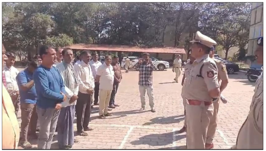
ಪರೀಕ್ಷೆಯ ಬುಧವಾರ ಬೆಳಿಗ್ಗೆ ನವನಗರದ ಅಬಕಾರಿ ಉಪ ಆಯುಕ್ತರ ಕಚೇರಿ ಆವರಣದಲ್ಲಿ ಸದರಿ ಆರೋಪಿಗಳು ಪ್ರಸ್ತುತ ನಿರ್ವಹಿಸುತ್ತಿರುವ

ವಿಜಯಸಾಕ್ಷಿ ಸುದ್ದಿ, ಧಾರವಾಡ ಸನ್ನದೇಶರ ಪ್ರದೇಶಗಳಲ್ಲಿ ಅಕ್ರಮ ಮದ್ಯ ಮಾರಾಟ, ನೀರು ಮಿಶ್ರಿತ ಮದ್ಯಸಾರ ಮಾರಾಟ, ಹೊರ ರಾಜ್ಯದ ಮದ್ಯ ಮಾರಾಟ, ಕಳ್ಳಭಟ್ಟಿ ಹಾಗೂ ನಕಲಿ ಮದ್ಯ ಮಾರಾಟ ಹಾಗೂ ಯಾವುದೇ ರೀತಿಯ ಮಾದಕ ವಸ್ತುಗಳ ಮಾರಾಟದಂತಹ ಪ್ರಕರಣಗಳಲ್ಲಿ ಭಾಗಿಯಾಗಿ ಅಪರಾಧಗಳಲ್ಲಿ ತೊಡಗಿದ್ದ ಹಳೆಯ ಆರೋಪಿಗಳ ಚಲನ-ವಲನಗಳ ಮೇಲೆ ತೀವ್ರ ನಿಗಾ ವಹಿಸುವ ನಿಟ್ಟಿನಲ್ಲಿ ಮತ್ತು ಅಕ್ರಮ ಮದ್ಯ ಮಾರಾಟವನ್ನು ಸಂಪೂರ್ಣವಾಗಿ ತಡೆಗಟ್ಟುವ ನಿಟ್ಟಿನಲ್ಲಿ ಜಿಲ್ಲೆಯಾದ್ಯಂತ ಇರುವ ಹಳೆಯ 150 ಆರೋಪಿಗಳ