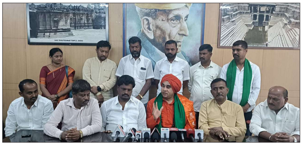
ಸರ್ಕಾರ ಮೀಸಲಾತಿ ನಿರಾಕರಣೆ ಮಾಡಿರುವುದನ್ನು ತಿಳಿಸುತ್ತೇವೆ. ಪ್ರತಿಜ್ಞಾ ಕ್ರಾಂತಿ ಹೆಸರಿನಲ್ಲಿ ರಾಜ್ಯದ 224 ಕ್ಷೇತ್ರಗಳಲ್ಲಿ ಸಂಚಾರವನ್ನು ಈಗಾಗಲೇ ಜನವರಿ 14ರಿಂದ ಬೆಳಗಾವಿಯಿಂದ ಆರಂಭ ಮಾಡಲಾಗಿದೆ. ನಮ್ಮ ಹೋರಾಟ ಹತ್ತಿಕ್ಕಲು ಪ್ರಯತ್ನ ಮಾಡಿದರೆ ಹೆದರುವುದು ನಾವಿಲ್ಲ. ನಮ್ಮ ಹೋರಾಟ ಯಾವುದೇ ಕಾರಣಕ್ಕೂ ನಿಲ್ಲುವುದಿಲ್ಲ ಎಂದು ಕಿಟುವಾಗಿ ಹೇಳಿದರು. ಕಳೆದ ನಾಲ್ಕು ವರ್ಷದಿಂದ ಪಂಚಮಸಾಲಿಗಳ ಶಾಂತಿಯುತ ಹೋರಾಟ ಮಾಡಿಕೊಂಡು ಬಂದಿದ್ದಾರೆ. ಆದರೆ, ಡಿಸೆಂಬರ್‌ನಲ್ಲಿ ನಡೆದ ಹೋರಾಟವನ್ನು ರಾಜ್ಯ ಸರ್ಕಾರ ಹತ್ತಿಕ್ಕುವ ಪ್ರಯತ್ನ ಮಾಡಿ