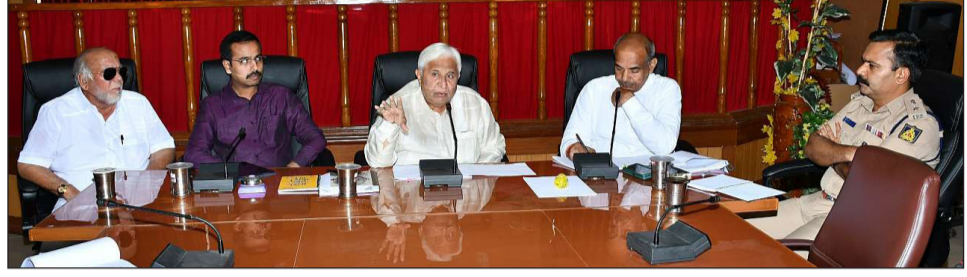
ಬುಧವಾರ ಗದಗ-ಬೆಟಗೇರಿ ಅವಳಿ ನಗರಕ್ಕೆ ಕುಡಿಯುವ ನೀರು ಪೂರೈಕೆ ಕುರಿತಂತೆ ಸಭೆ ಜರುಗಿಸಿ ನಂತರ ಪತ್ರಿಕಾಗೋಷ್ಠಿಯನ್ನೆರವಿಸಿ ಅವರು ಮಾತನಾಡಿದರು.

■ ವಿಜಯಸಾಕ್ಷಿ ಸುದ್ದಿ, ಗದಗ ಕುಡಿಯುವ ನೀರಿನ ಅಭಿವೃದ್ಧಿಯನ್ನು ಗಂಭೀರವಾಗಿ ಪರಿಗಣಿಸಲಾಗಿದೆ. ಈ ಹಿನ್ನೆಲೆಯಲ್ಲಿ ನೀರಿನ ಪೂರೈಕೆಗೆ ಸಂಬಂಧಿಸಿದಂತೆ ಕಾರ್ಯಗಳ ಪಟ್ಟಿ ತಯಾರು ಮಾಡಲಾಗಿದೆ. ತೀವ್ರವೇ ನಿಯಮಿತ ನೀರು ಪೂರೈಕೆಗೆ ಸೂಚಿಸಲಾಗಿದೆ ಎಂದು ರಾಜ್ಯದ ಕಾನೂನು, ನ್ಯಾಯ, ಮಾನವ ಹಕ್ಕುಗಳು, ಸಂಸದೀಯ ವ್ಯವಹಾರಗಳು, ಶಾಸನ ರಚನೆ ಮತ್ತು ಪ್ರವಾಸೋದ್ಯಮ ಸಚಿವರು ಹಾಗೂ ಗದಗ ಜಿಲ್ಲಾ ಉಸ್ತುವಾರಿ ಸಚಿವರಾದ ಡಾ. ಎಚ್.ಕೆ. ಪಾಟೀಲ ಅವರು ತಿಳಿಸಿದರು. ಗದಗ ಜಿಲ್ಲಾಡಳಿತ ಭವನದ ಸಭಾಂಗಣದಲ್ಲಿ ಮೈಕ್ರೋ ಪ್ಲಾನಿಂಗ್, ಸಂಸ್ಥೆಗಳ ದಂಧೆ ಹಾಗೂ ಮೀಟರ್ ಬಡ್ಡಿ ಮಾಫಿಯಾಕ್ಕೆ ಕಡಿವಾಣಿ ಹಾಕಲು ನೂತನ ಕಾಯ್ದೆ ಜಾರಿ ತರಲು ಸರ್ಕಾರ ನಿರ್ದೇಶಿಸಿದೆ. ಮುಂದಿನ ಅಧಿವೇಶನದಲ್ಲಿಯೇ ವಿಧೇಯಕ ಮಂಡಿಸಲಾಗುವುದು. ಬಡವರ, ಮಧ್ಯಮ ವರ್ಗದವರ ಶೋಷಣೆ ತಡೆಗಟ್ಟುವುದು ಹಾಗೂ ಅವರನ್ನು ಸಂರಕ್ಷಿಸುವುದು ನಮ್ಮ ಸರ್ಕಾರದ ಕರ್ತವ್ಯವಾಗಿದೆ. - ಎಚ್.ಕೆ. ಪಾಟೀಲ. ಗದಗ ಉಸ್ತುವಾರಿ ಸಚಿವರು.