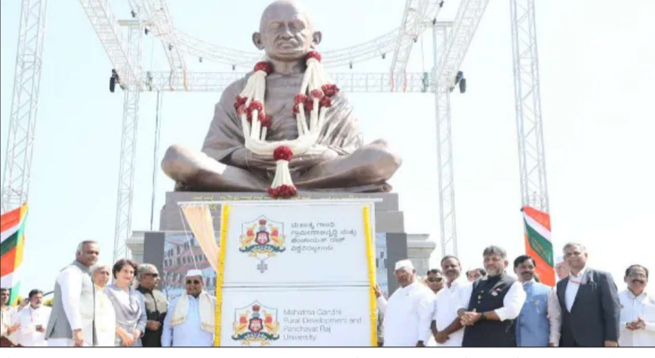
ದ್ವೇಷಿಯಾಗಿರುವ ಹಾಗೂ ಗಾಂಧಿ ತತ್ವದ ವಿರೋಧಿಯಾಗಿರುವ ಬಿಜೆಪಿ ಪರಿವಾರವು ಸಂವಿಧಾನ ಮಹಾತ್ಮ ಗಾಂಧಿಯವರ ವಿಚಾರಗಳನ್ನು ಮುಂದಿನ

■ ವಿಜಯಸಾಕ್ಷಿ ಸುದ್ದಿ, ಬೆಟಗಾವಿ ರಾಮ ಭಕ್ತರಾಗಿದ್ದ ಶುದ್ಧ ಆತ್ಮದ ಹಿಂದೂ ಆಗಿದ್ದ ಮಹಾತ್ಮ ಗಾಂಧಿಯನ್ನು ಬಿಜೆಪಿ ಪರಿವಾರದ ಗೋಡ್ಡೆ ಹತ್ತಿ ಮಾಡಿದೆ. ನಾವು ಮಹಾತ್ಮ ಗಾಂಧಿ ಅವರ ಹಿಂದೂತ್ವದಲ್ಲಿ ನಂಬಿಕೆ ಇಟ್ಟಿದ್ದೇವೆ. ಬಿಜೆಪಿ ಪರಿವಾರವು ಗೋಡ್ಡೆಯ ಕೊಲೆಗಡುಕ ಸಿದ್ಧಾಂತವನ್ನು ಪಾಲಿಸುತ್ತಿದೆ ಎಂದು ಸಿಎಂ ಸಿದ್ದರಾಮಯ್ಯ ವಾಗ್ದಾಳಿ ನಡೆಸಿದರು. ಬೆಟಗಾವಿಯಲ್ಲಿ 1924ರಲ್ಲಿ ಮಹಾತ್ಮ ಗಾಂಧೀಜಿಯವರ ಅಧ್ಯಕ್ಷತೆಯಲ್ಲಿ ನಡೆದಿದ್ದ ಕಾಂಗ್ರೆಸ್ ಅಧಿವೇಶನದ ಶತಮಾನೋತ್ಸವದ ಸ್ಮರಣಾರ್ಥ ರಾಜ್ಯ ಕಾಂಗ್ರೆಸ್ ವತಿಯಿಂದ ಮಂಗಳವಾರ ಬೆಟಗಾವಿಯಲ್ಲಿ ಹಮ್ಮಿಕೊಂಡಿದ್ದ ಗಾಂಧಿ ಭಾರತ ಕಾರ್ಯಕ್ರಮದ ಅಂಗವಾಗಿ ಬೆಟಗಾವಿಯ ಸುಖಾನ್ವಿತದ ಅನಾವರಣದಲ್ಲಿ ಮಹಾತ್ಮ ಗಾಂಧಿಯವರ ಪ್ರತಿಮೆ ಅನಾವರಣ ಕಾರ್ಯಕ್ರಮದಲ್ಲಿ ಅವರು ಮಾತನಾಡುತ್ತಿದ್ದರು. ಗಾಂಧೀಜಿಯವರು ಹೇಳಿದ ಹಿಂದುತ್ವದ ದ್ವೇಷಿಯಾಗಿರುವ ಹಾಗೂ ಗಾಂಧಿ ತತ್ವದ ವಿರೋಧಿಯಾಗಿರುವ ಬಿಜೆಪಿ ಪರಿವಾರವು ಸಂವಿಧಾನ ಮಹಾತ್ಮ ಗಾಂಧಿಯವರ ವಿಚಾರಗಳನ್ನು ಮುಂದಿನ