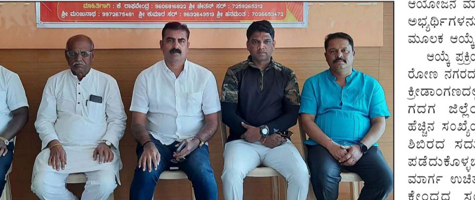
ನಗರದಲ್ಲಿ ನಡೆಯಲಿದೆ. ನಡೆದ ಶಿಬಿರದಲ್ಲಿ ಪಾಲ್ಗೊಂಡ 84 ಯುವ ಮಾರ್ಗ ನೈನಿಕ ತರಬೇತಿ ಕೇಂದ್ರದಿಂದ ಕೊಪ್ಪಳದಲ್ಲಿ ನೈನಿಕ ತರಬೇತಿ ಶಿಬಿರ ರೋಣ

■ ವಿಜಯಸಾಕ್ಷಿ ಸುದ್ದಿ, ಗದಗ ಸ್ವಾಮಿ ವಿವೇಕಾನಂದರ 162ನೇ ಜಯಂತಿಯ ಅಂಗವಾಗಿ ಎಲ್. ಆರ್. ದಿಂಡೂರ ಅಂಗ ಮಾಧ್ಯಮ ಶಾಲೆ ರೋಣ, ಜೈ ನರೇಂದ್ರ ಯುವ ಜನ ಹಿತ ಸಂಸ್ಥೆ, ಯುವ ಮಾರ್ಗ ಉಚಿತ ನೈನಿಕ ತರಬೇತಿ ಕೇಂದ್ರ ಬಾಗಲಕೋಟೆ ಮತ್ತು ಮಾಜಿ ನೈನಿಕ ಪ್ರಕೋಪ್ತಗಳ ಸಂಯೋಜನೆಯಲ್ಲಿ ಅಗ್ನಿವೀರ ಮತ್ತು ಆರ್ಮಿ ನೈನಿಕ ತರಬೇತಿ ನಡೆಯಲಿದ್ದು, ಸೈನ್ಯ ಸೇರಬಯಸುವ ಗದಗ ಜಿಲ್ಲೆಯ ಯುವಕರಿಗೆ ಜ.27ರಿಂದ 30 ದಿನಗಳ ಉಚಿತ ನೈನಿಕ ತರಬೇತಿ ಶಿಬಿರ ರೋಣ