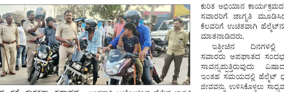
ವತಿಯಿಂದ ರಸ್ತೆ ಸುರಕ್ಷತಾ ಸಪ್ತಾಹದ ಅಂಗವಾಗಿ ಆಯೋಜಿಸಿದ್ದ ಹೆಲ್ಮೆಟ್ ಜಾಗೃತಿ