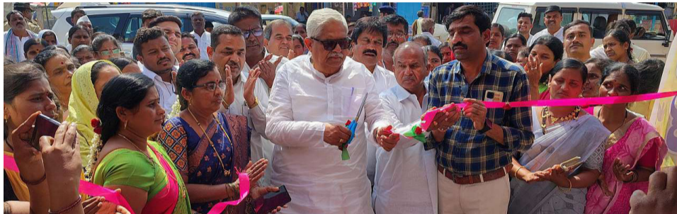
ಗ್ರಾಮ ಪಂಚಾಯತಿ ವ್ಯಾಪ್ತಿಯ 13 ಮಹಿಳಾ ಸ್ವ-ಸಹಾಯ ಸಂಘಗಳ ಸದಸ್ಯರು ತಾವು ತಯಾರಿಸಿದ ಉತ್ಪನ್ನಗಳನ್ನು ಪ್ರದರ್ಶನ ಹಾಗೂ ಮಾರಾಟಕ್ಕೆ ಇಟ್ಟಿದ್ದರು.

ಜಿ.ಪಂ ಯೋಜನಾ ನಿರ್ದೇಶಕ ಎಮ್.ವಿ. ಚರ್ಚೆಗೆ ಮಾತನಾಡಿ, ಸಂಜೀವಿನಿ ಸಂಘದ ಉತ್ಪನ್ನವು ಮಾರುಕಟ್ಟೆಯಲ್ಲಿ ಗುರುತಿಸಿಕೊಳ್ಳುವಂತೆ ಮಾಡಲು ಅದರಲ್ಲಿ ವಿಭಿನ್ನತೆಯರಬೇಕು, ಉತ್ಪನ್ನದ ಗುಣಮಟ್ಟ ಮತ್ತು ಅದನ್ನು ಗ್ರಾಹಕರಿಗೆ ನೀಡುವಾಗ ಉತ್ತಮ ಪ್ಯಾಕೇಜಿಂಗ್ ಹೊಂದಿರಬೇಕು. ಆಗ ಮಾತ್ರ ಉತ್ಪನ್ನಗಳು ಜನರನ್ನು ತಲುಪುತ್ತವೆ. ಮಾರುಕಟ್ಟೆಯಲ್ಲಿ ಸ್ಪರ್ಧಾತ್ಮಕ ಬೆಲೆಯನ್ನು ನಿಗದಿಪಡಿಸಿದಾಗ ಮಾತ್ರ ಹೆಚ್ಚಿನ ವಸ್ತುಗಳು ಮಾರಾಟವಾಗುತ್ತವೆ. ಈ ನಿಟ್ಟಿನಲ್ಲಿ ನಿಮ್ಮ ಕಾರ್ಯ ನಿರ್ವಹಿಸಬೇಕು ಎಂದು ಹೇಳಿದರು.