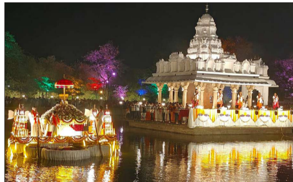
■ ವಿಜಯಸಾಕ್ಷಿ ಸುದ್ದಿ, ಕೊಪ್ಪಳ ನಿಮಿತ್ತ ಶ್ರೀ ಮಠದಿಂದ ಶ್ರೀ ಗವಿಸಿದ್ಧೇಶ್ವರ ಜರುಗುವ ಸಾಂಪ್ರದಾಯಿಕ ಜಾತ್ರಾ ಮಹೋತ್ಸವದ ಕಾರ್ಯಕ್ರಮಗಳಲ್ಲೊಂದಾದ

ತೆಪ್ಪೋತ್ಸವ ಹಾಗೂ ಸಂಗೀತ ಗವಿಮಠದ ಕೆರೆಯ ದಡದಲ್ಲಿ ಕಾರ್ಯಕ್ರಮವು ಕಾರ್ಯಕ್ರಮವು ಜರುಗಿತು. ಸೋಮವಾರ ಸಂಜೆ ಶ್ರೀ ಜಾತ್ರಾ ಮಹೋತ್ಸವದಲ್ಲಿ ಕಣ್ಮನ ಸೆಳೆಯುವ ಉತ್ತಮ ತೆಪ್ಪೋತ್ಸವ. ತೆಪ್ಪೋತ್ಸವಕ್ಕೆ ಭಕ್ತರು ಆಗಮಿಸಿ ಮಹಾಮಹಿಮೆ ಕೃತಿ ಗವಿಸಿದ್ಧೇಶ್ವರನನ್ನು ಸಂಕಲ್ಪ ಮಾಡಿಕೊಂಡರೆ ಇಷ್ಟಾರ್ಥ ಸಿದ್ಧಿಸುತ್ತದೆಂಬ ನಂಬಿಕೆ ಭಕ್ತಾದಿಗಳಲ್ಲಿದೆ. ತೆಪ್ಪೋತ್ಸವ ಎಂದರೆ ಬಾವಿ, ಕೆರೆ, ನದಿಗಳಲ್ಲಿ ತೆಪ್ಪದ ಮೇಲೆ ನಡೆಯುವ ದೇವರ ಉತ್ಸವವೆಂದು ಅರ್ಥ. ಎರಡು ತೆಪ್ಪುಗಳ ನಡುವೆ ಹಲಗೆಯಿಂದ ನಿರ್ಮಿಸಲಾದ ವೇದಿಕೆಯಲ್ಲಿ ಶ್ರೀ ಗವಿಸಿದ್ಧೇಶ್ವರ ಸ್ವಾಮಿಯ ಉತ್ತಮ ಮೂರ್ತಿಯನ್ನು ಪ್ರತಿಷ್ಠಾಪಿಸಿ ಅಲಂಕೃತಗೊಂಡ ಪಲ್ಲಕ್ಕಿಯಲ್ಲಿ ಶ್ರೀ ಗವಿಸಿದ್ಧೇಶ್ವರ ಮೂರ್ತಿಯನ್ನು ಮಂಗಳವಾದ್ಯಗಳೊಂದಿಗೆ ಕೆರೆ ತಂದು ಮೂರ್ತಾರ್ಥಗೋಷಿದ ತೆಪ್ಪವನ್ನು ನಾಲ್ಕು ದಿಕ್ಕುಗಳಲ್ಲಿ ಭಕ್ತಾದಿಗಳು ಸಾಗಿಸುತ್ತಾರೆ.