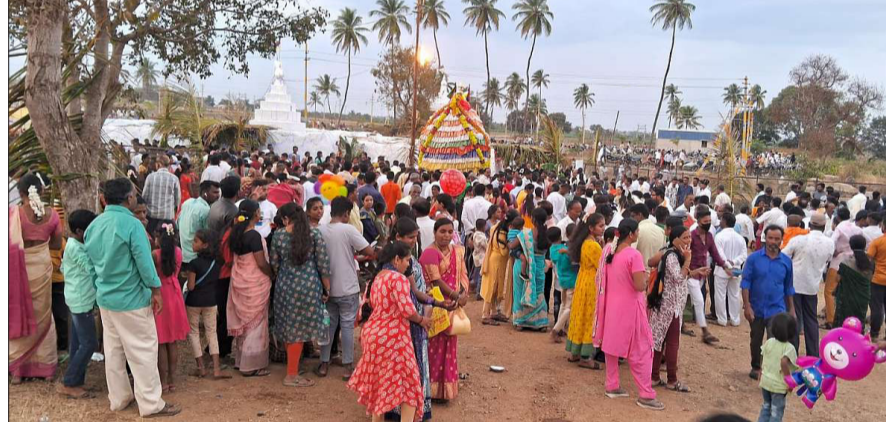
■ ವಿಜಯಸಾಕ್ಷಿ ಸುದ್ದಿ, ಲಕ್ಷ್ಮೇಶ್ವರ ಮಹರ್ಷಿ ಅಗಸ್ತ್ಯ ಮುನಿಗಳು ಮುನಿಗಳು ಇಲ್ಲಿಗೆ ಬಂದು ಸಪ್ತರೂಪಿಗಳಲ್ಲಿ ವೇದ ಒಬ್ಬರಾಗಿದ್ದು, ಅಗಸ್ತ್ಯ ಶಿವಲಿಂಗವನ್ನು ಸ್ಥಾಪಿಸಿ, ತಪಸ್ಸು

ಮಾಡಿದ್ದಾರೆಂದು ಪ್ರತೀತಿಯಿದೆ. ಅಗಸ್ತ್ಯತೀರ್ಥ ಕ್ಷೇತ್ರದಲ್ಲಿ ಸಂಕ್ರಾಂತಿಯಂದು ನಡೆಯುವ ಜಾತ್ರೆಯು ಮಂಗಳವಾರ ಸಾವಿರಾರು ಭಕ್ತರ ಉದ್ಯೋಷದ ನಡುವೆ ವಿಜೃಂಭಣೆಯಿಂದ ಜರುಗಿತು. ಮಂಗಳವಾರ ಸಂಜೆ ಸಾವಿರಾರು ಭಕ್ತರ ಘೋಷಣೆಯ ಮಧ್ಯೆ ರಥೋತ್ಸವ ನಡೆಯಿತು. ಗ್ರಾಮೀಣ ಪ್ರದೇಶಗಳಿಂದ ಜಾತ್ರೆಗೆ ಆಗಮಿಸಿದ್ದ ಸಾವಿರಾರು ಭಕ್ತರು ತೇರಿಗೆ ಉತ್ತಮ ಬಾಳೆಹಣ್ಣುಗಳನ್ನು ಎಸೆದು ಭಕ್ತಿ ಮೆರೆದರು.