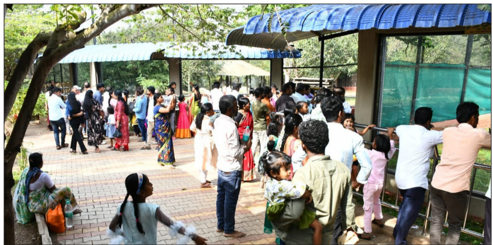
ಸಾಲುಮರದ ತಿಮ್ಮಕ್ಕ ಪಾರ್ಕ್‌ಗೆ ತೆರಳಿ, ಅಲ್ಲಿ ಜೋಕಾಲಿ ಸೀಸಾ, ಜಾರುಬಂಡಿ, ಸಾಹಸ ಕ್ರೀಡೆಗಳನ್ನು ಆಡಿ ಮೆರೆದರು. ಮಹಿಳೆಯರು, ಪುರುಷರು, ಮಕ್ಕಳು ವಿವಿಧ ಆಟಗಳನ್ನು ಆಡಿ ಮುಷ್ಕಿಪಟ್ಟರು. ಸಿಂಹ, ಹುಲಿಗಳು ಘರ್ಜನೆಯ ಮೂಲಕ ಪ್ರಾಣಿ ಪ್ರಿಯರನ್ನು ರಂಜಿಸಿದರೆ, ಬಣ್ಣ ಬಣ್ಣದ ಪಕ್ಕಿಗಳು ಇಂಪಾದ ಧ್ವನಿಗಳ

■ ವಿಜಯಸಾಕ್ಷಿ ಸುದ್ದಿ, ಗದಗ ನೂತನ ವರ್ಷದ ಮೊದಲ ಹಬ್ಬ ಮಕರ ಸಂಕ್ರಮಣ ಬಂತೆಂದ ಮುದ್ದಣ ಕಾಶಿ ಗದುಗಿನಲ್ಲಿ ಸಂಭ್ರಮ ಮುಗಿಲು ಮುಟ್ಟುತ್ತದೆ. ಸಾಲು ಸಾಲು ರಜೆ ಬಂತೆಂದರಂತೂ ಶಾಲಾ ಮಕ್ಕಳಿಗೆ, ನೌಕರ ವರ್ಗದವರಿಗೆ ರಜೆಯ ಮಜಾ ಅನುಭವಿಸುವ ಕಾತರ. ಈ ಹಬ್ಬದ ಸಂದರ್ಭದಲ್ಲಿ ಕುಟುಂಬ ಸಮೇತರಾಗಿ ಬಿಂಕದಕಟ್ಟೆ ಮೈಗಾಲಯ ಭೇಟಿ ನೀಡುವ ಸಂಪ್ರದಾಯ ಬೆಳೆಸಿಕೊಂಡು ಬಂದಿದ್ದಾರೆ. ನಾಡಿನಾದ್ಯಂತ ಸಂಕ್ರಾಂತಿಯನ್ನು ಸಂಭ್ರಮದಿಂದ ಆಚರಿಸಲಾಗುತ್ತಿದೆ. ಆದರೆ ಗದುಗಿನಲ್ಲಿ ಮಾತ್ರ ಸಂಕ್ರಾಂತಿ ಹಬ್ಬವನ್ನು ಇನ್ನೂ ವಿಶೇಷವಾಗಿ ಆಚರಿಸಲಾಗುತ್ತಿದೆ. ಹಬ್ಬದ ಈ ಸಂಭ್ರಮದ ಘಳಿಗೆಯಲ್ಲಿ ಜಿಲ್ಲೆಯ ಸಾರ್ವಜನಿಕರು ಬಿಂಕದಕಟ್ಟೆ ಮೈಗಾಲಯಕ್ಕೆ ಕುಟುಂಬ ಸಮೇತರಾಗಿ ಭೇಟಿ ನೀಡಿ, ಮನೆಯಿಂದ ತಂದ ತರಕಾರಿ ಅಡುಗೆ ಊಟ ಮಾಡಿ ಸಂಭ್ರಮದಿಂದ ಕಾಲ ಕಳೆದರು. ಎಲ್ಲ ಪ್ರಾಣಿಗಳನ್ನು ನೋಡಿ ಬಳಿಕ ಪಕ್ಕದಲ್ಲಿರುವ