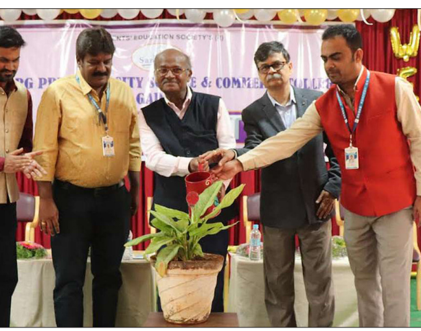
ತೆರಿಗೆಸುವ ಶಿಕ್ಷಕರನ್ನು ಗೌರವ ಭಾವದಿಂದ ಕಂಡಾಗ ಸನ್ಯಾಸರ ಪ್ರಥಮ ಸಂಸ್ಥೆಯ ಚೇರಮನ್ ಪ್ರೊ.