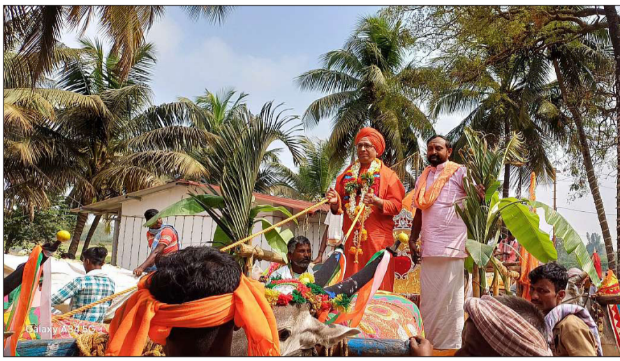
ಶ್ರೀಗಳೇ ಭಕ್ತರ ಮನೆ ಬಾಗಿಲಿನತ್ತ ಬರುತ್ತಾರೆಂಬ ಸಂಭ್ರಮದಿಂದ ಗ್ರಾಮ