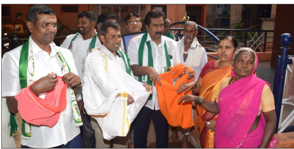
ಪುಟ್ಟರಾಜರ ಸ್ಮಾರಕ ಭವನ ನಿರ್ಮಾಣಕ್ಕೆ ಜಿಡಿಎಸ್‌ನಿಂದ ಸಾಂಕೇತಿಕ ಭಿಕ್ಷಾಟನ

■ ವಿಜಯಸಾಕ್ಷಿ ಸುದ್ದಿ, ಗದಗ ವೀರೇಶ್ವರ ಪುಣ್ಯಾಶ್ರಮದ ಆವರಣದಲ್ಲಿರುವ ಪಂ. ಪುಟ್ಟರಾಜ ಗವಾಯಿಗಳ ಸ್ಮಾರಕ ಭವನ ನಿರ್ಮಾಣ ಕಾಮಗಾರಿ ವಿಳಂಬಕ್ಕೆ ಕಾರಣವಾದ ಸರ್ಕಾರದ ಧೋರಣೆಯನ್ನು ಖಂಡಿಸಿ ಜಿಡಿಎಸ್ ಕಾರ್ಯಕರ್ತರು ಶುಕ್ರವಾರ ಸಾಂಕೇತಿಕ ಭಿಕ್ಷಾಟನೆ ನಡೆಸುವ ಮೂಲಕ ಸರ್ಕಾರಕ್ಕೆ ಎಚ್ಚರಿಕೆ ನೀಡಿದರು.