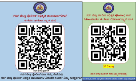
ಗದಗ ಜಿಲ್ಲಾ ಪೊಲೀಸ್ ವತಿಯಿಂದ ಜನೋಪಯೋಗಿ ಕ್ರಮ | ಸಾರ್ವಜನಿಕರಿಂದ ಅಪಾರ ಮೆಚ್ಚುಗೆ

ಮಾಹಿತಿ ರವಾನಿಸುವುದು ಸುಲಭವಾಗುತ್ತದೆ ಎನ್ನುವ ಉದ್ದೇಶದಿಂದ ಗದಗ ಜಿಲ್ಲಾ ಪೊಲೀಸ್