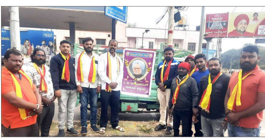
ಕಂಪನಿಗಳ ಮೂಲಕ ಭಾರತೀಯರ ಅರ್ಥಿಕ ಮಧ್ಯಮ, ಮೇಲ್ಮಧ್ಯಮ ವರ್ಗಕ್ಕೆ ಉದ್ಯೋಗ ಸೃಷ್ಟಿ ಮಾಡಿ ಸ್ಥಿತಿಯನ್ನು ಕೆಳವರ್ಗದಿಂದ ಕೊಂಡೊಯ್ಯುವಲ್ಲಿ ಬಹುಮುಖ್ಯ