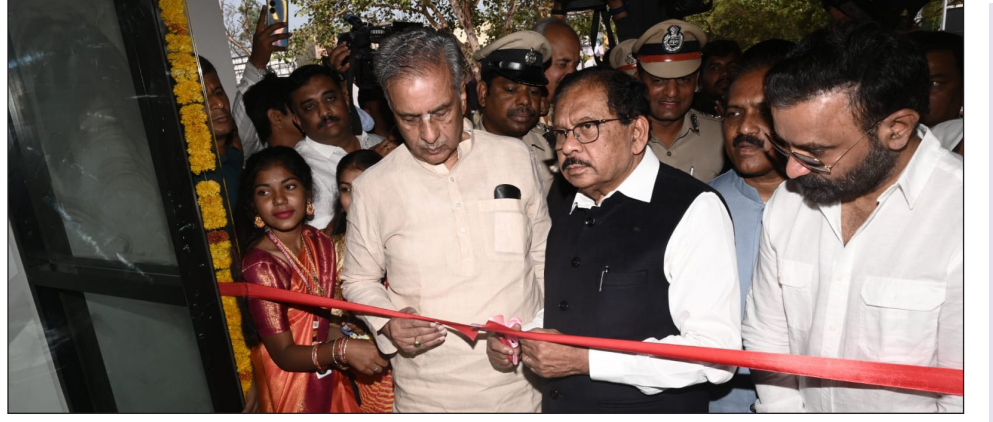
ರಿತಿಯಲ್ಲಿ ಹುಬ್ಬಳ್ಳಿ-ಧಾರವಾಡ ನಗರಗಳನ್ನು ಡ್ರಗ್ಸ್ ಮುಕ್ತ ಮಾಡುವಲ್ಲಿ ಪೊಲೀಸ್ ಆಯುಕ್ತರು ಮುಂದಾಗಬೇಕು. ಬೆಂಗಳೂರಿನಲ್ಲಿ ನೈಜೀರಿಯಾ ಮಹಿಳೆಯಿಂದ ರೂ.25 ಕೋಟಿ ಮೌಲ್ಯದ 14 ಕೆ.ಜಿ. ಡ್ರಗ್ಸ್ ವಶಪಡಿಸಿಕೊಳ್ಳಲಾಗಿದೆ ಎಂದು ಅವರು ತಿಳಿಸಿದರು.

ಮಂಗಳವಾರ ಹುಬ್ಬಳ್ಳಿ ಗ್ರಾಮೀಣ ಪೊಲೀಸ್ ಠಾಣೆಯಲ್ಲಿ ಕರ್ನಾಟಕ ರಾಜ್ಯ ಪೊಲೀಸ್ ಹಾಗೂ ಹುಬ್ಬಳ್ಳಿ-ಧಾರವಾಡ ಪೊಲೀಸ್ ಆಯುಕ್ತಾಲಯದ ವತಿಯಿಂದ ಹುಬ್ಬಳ್ಳಿ ಗ್ರಾಮೀಣ ಪೊಲೀಸ್ ಠಾಣೆಯ ನೂತನ ಕಟ್ಟಡವನ್ನು ಉದ್ಘಾಟಿಸಿ ಅವರು ಮಾತನಾಡಿದರು. ಈಗಾಗಲೇ ಕೆಲವು ಜಿಲ್ಲೆಗಳಲ್ಲಿ ಪೊಲೀಸರು ಆಯಾ ಜಿಲ್ಲೆಗಳನ್ನು ಡ್ರಗ್ಸ್ ಮುಕ್ತ ಮಾಡುತ್ತೇವೆ ಎಂದಿದ್ದಾರೆ. ಅದೇ