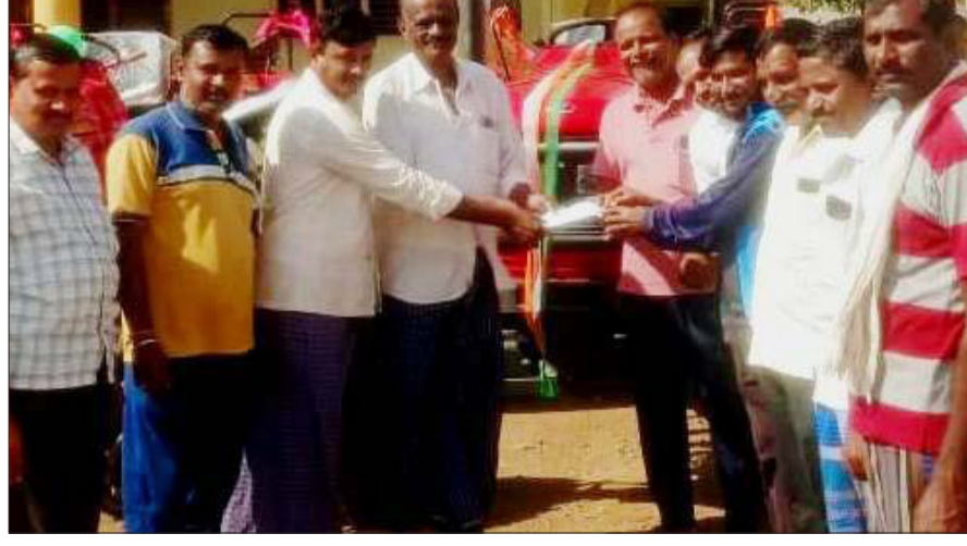
ಮಾಡಿ ಟ್ರಾಕ್ಟರ್ ಸಾಲ, ಗೃಹಬಳಕೆ ಸಾಲ, ವ್ಯಾಪಾರಕ್ಕಾಗಿ ಸಾಲ, ಹೈನುಗಾರಿಕೆ ಅಲ್ಲದೆ ಇನ್ನಿತರ ವ್ಯಾಪಾರಕ್ಕಾಗಿ ಅಗತ್ಯಕನುಗುಣವಾಗಿ ಸಾಲವನ್ನು