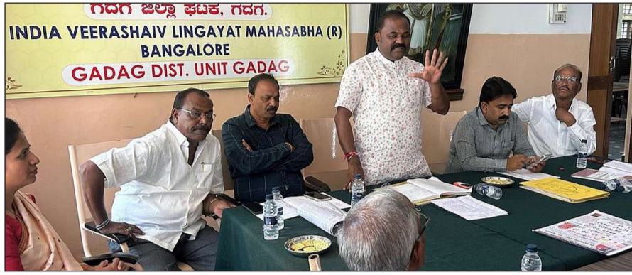
ಗದಗ ಜಿಲ್ಲಾ ಘಟಕ, ಗದಗ, INDIA VEERASHAIV LINGAYAT MAHASABHA (R) BANGALORE GADAG DIST. UNIT GADAG