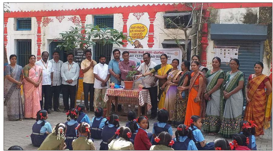
5ರ ಮುಖ್ಯೋಪಾಧ್ಯಾಯರಿಗಾಗಿ ಏರ್ಪಡಿಸಿದ್ದ ವಿಶೇಷ ಚೇತನ ಮಕ್ಕಳ ಶೈಕ್ಷಣಿಕ ಅಭಿವೃದ್ಧಿ ಹಾಗೂ