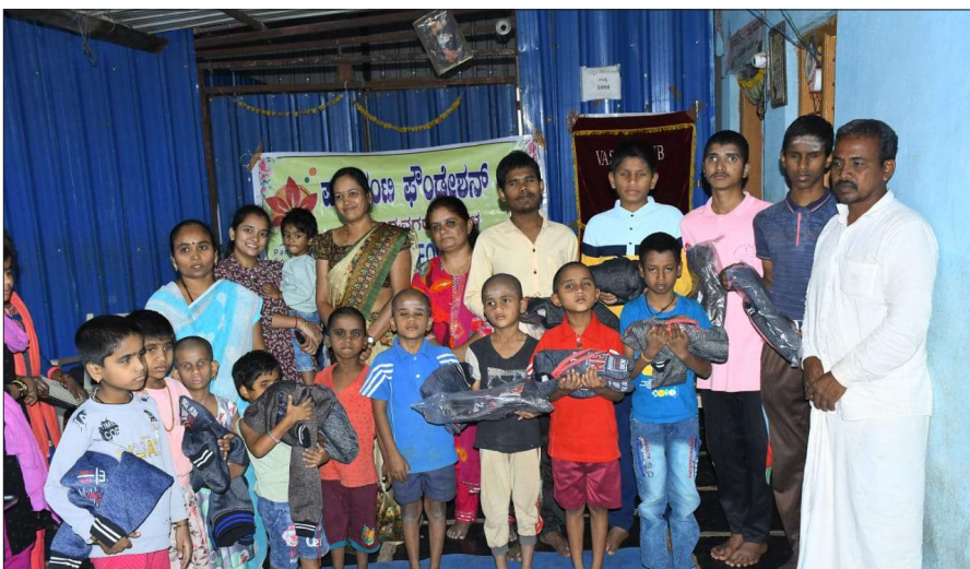
ಮಕ್ಕಳು. ಕಣ್ಣಿಲ್ಲದಿದ್ದರೂ ಕಟ್ಟಿಕೊಂಡವರು. ಯಾವುದೇ ಮನೋಭಾವ ಇಲ್ಲದೆ ತಮ್ಮ ತಾತ್ಸಾರ-ಅಸೂಯೆಯ ಪ್ರತಿಭೆಯ ಮೂಲಕವೇ