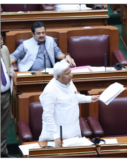
ನಿರ್ವಹಣೆಯನ್ನು ಸಹ ಪ್ರತ್ಯೇಕವಾಗಿ ಇಡಲು ಹಾಗೂ ಸಾರ್ವಜನಿಕ ಹಿತದೃಷ್ಟಿಯಿಂದ ವಿಧೇಯಕವನ್ನು ಮಂಡಿಸಲಾಗುತ್ತಿದೆ. ಇದಕ್ಕೆ

■ ವಿಜಯಸಾಕ್ಷಿ ಸುದ್ದಿ, ಬೆಳಗಾವಿ-ಸುವರ್ಣಸೌಧ ರಾಜ್ಯದಲ್ಲಿ 15 ಸ್ಥಳಗಳಲ್ಲಿ ರೋಪ್‌ವೇಗಳ ನಿರ್ಮಾಣಕ್ಕೆ ಸರ್ಕಾರ ನಿರ್ಣಯ ಕೈಗೊಂಡಿದೆ. ಇವುಗಳ ನಿರ್ಮಾಣ ಮತ್ತು ಕಾರ್ಯನಿರ್ವಹಣೆಯನ್ನು ಅಧಿಕೃತಗೊಳಿಸಿ, ಸುಗಮಗೊಳಿಸುವ ಹಾಗೂ ನಿಯಂತ್ರಿಸುವ ಸಲುವಾಗಿ 2024ನೇ ಸಾಲಿನ ಕರ್ನಾಟಕ ಪ್ರವಾಸೋದ್ಯಮ ರೋಪ್‌ವೇಗಳ ವಿಧೇಯಕವನ್ನು ಜಾರಿಗೆ ತರಲಾಗುತ್ತಿದೆ ಎಂದು ಕಾನೂನು ಸಂಸದೀಯ ವ್ಯವಹಾರಗಳು ಮತ್ತು ಶಾಸನ ರಚನೆ ಹಾಗೂ ಪ್ರವಾಸೋದ್ಯಮ ಸಚಿವ ಎಚ್.ಕೆ. ಪಾಟೀಲ ಹೇಳಿದರು. ಸುವರ್ಣ ಸೌಧದಲ್ಲಿ ಸೋಮವಾರ ವಿಧಾನ ಸಭೆ ಕಲಾಪದಲ್ಲಿ ವಿಧೇಯಕವನ್ನು ಸದನದ ಪರ್ಯಾಲೋಚನೆಗೆ ಅವರು ಮಂಡಿಸಿದರು. ರೋಪ್‌ವೇಗಳ ನಿರ್ಮಾಣದಿಂದ ರಾಜ್ಯದಲ್ಲಿ ಪ್ರವಾಸೋದ್ಯಮಕ್ಕೆ ಇಂಟು ದೊರಕಲಿದೆ. ಈ ರೋಪ್‌ವೇಗಳ ನಿರ್ಮಾಣದ ಜೊತೆಗೆ