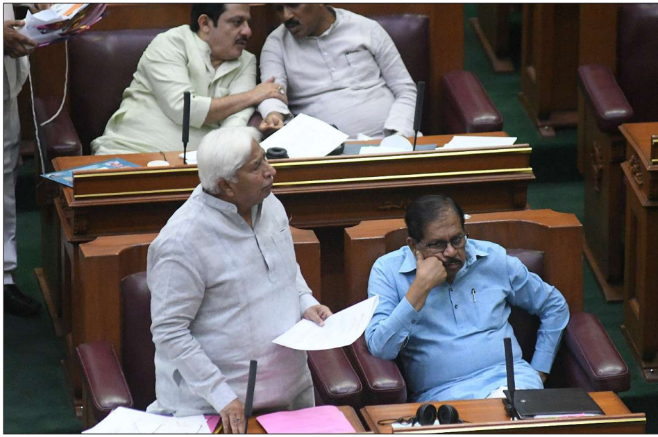
ಉದ್ಯಮಿಗಳಿಗೆ ಶೇ.5ರಷ್ಟು ಹೆಚ್ಚುವರಿ ಸಹಾಯಧನ ಸೌಲಭ್ಯಗಳನ್ನು ಒದಗಿಸಲು ಅವಕಾಶ ಕಲ್ಪಿಸಲಾಗಿದೆ.

ಪ್ರಸ್ತುತ ಜಾರಿಗೆ ತಂದಿರುವ 2024-29ರ ನೂತನ ಕರ್ನಾಟಕ ಪ್ರವಾಸೋದ್ಯಮ ನೀತಿಯಲ್ಲಿ ಬಾಗಲಕೋಟೆ ಹಾಗೂ ವಿಜಯಪುರ ಜಿಲ್ಲೆಗಳಲ್ಲಿ ಪ್ರವಾಸೋದ್ಯಮ ಅಭಿವೃದ್ಧಿಗಾಗಿ ಪ್ರವಾಸೋದ್ಯಮ ಕ್ಷೇತ್ರದ ಯೋಜನೆಗಳಲ್ಲಿ ಹೂಡಿಕೆ ಮಾಡಲು ಮುಂದೆ ಬರುವ ಖಾಸಗಿ