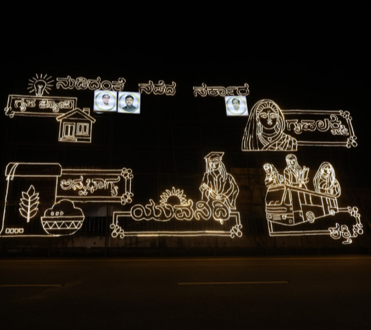
ಬೆಳಗಾವಿಯ ಸುವರ್ಣ ಸೌಧ ಗೇಟ್ ಮುಂಭಾಗ ನುಡಿದಂತೆ ನಡೆದ ಸರಕಾರ ಮತ್ತು ಮಧು ಗ್ಯಾರಂಟಿ ಯೋಜನೆಗಳ ಕುರಿತು ಮಿದುತ್ ಅಲಂಕಾರ ಗಮನಸೆಳೆಯುತ್ತಿದೆ.

ಉಲ್ಲಂಘಿಸಿದ 1245 ಪರವಾನಿಗಳನ್ನು ಅಮಾನತುಗೊಳಿಸಿದ್ದು, 292 ಪರವಾನಿಗಳನ್ನು ರದ್ದುಗೊಳಿಸಲಾಗಿದೆ. ಇಲಾಖೆಯ ಅಧಿಕಾರಿಗಳು ಮಾದಕ ಔಷಧಿಗಳ ದಾಸ್ತಾನು ಮತ್ತು ಮಾರಾಟಗಳ ಬಗ್ಗೆ ನಿಗಾವಹಿಸುತ್ತಿದ್ದು, ಇಲಾಖೆಯಲ್ಲಿ ಪ್ರತಿ ವರ್ಷ ಮಾದಕ ವಸ್ತುಗಳ ದುರ್ಬಳಕೆಯನ್ನು ತಡೆಗಟ್ಟಲು 3 ದಿನ ವಿಶೇಷ ಪರೀಕ್ಷಾರ್ಥ ಪರಿವೀಕ್ಷಣೆ ಕೈಗೊಂಡು ಉಲ್ಲಂಘನೆ ಕಂಡುಬಂದ ಸಂಸ್ಥೆಗಳ ವಿರುದ್ಧ ಕ್ರಮ ಜರುಗಿಸಲಾಗುತ್ತಿದೆ ಎಂದು. ಔಷಧ ನಿಯಂತ್ರಣ ಇಲಾಖೆಯಲ್ಲಿ ಒಟ್ಟು 112 ಔಷಧ ಪರಿವೀಕ್ಷಕರ ಹುದ್ದೆಗಳಲ್ಲಿ 08 ಹುದ್ದೆಗಳು ಮಾತ್ರ ಭರ್ತಿಯಾಗಿದೆ. ಕರ್ನಾಟಕ ಲೋಕ ಸೇವಾ ಆಯೋಗಕ್ಕೆ ಒಟ್ಟು 83 ಹುದ್ದೆಗಳನ್ನು ಭರ್ತಿ ಮಾಡಲು ಪ್ರಸ್ತಾವನೆ ಸಲ್ಲಿಸಲಾಗಿದ್ದು, ನೇಮಕಾತಿ ಸಂಬಂಧಿಸಿದ ಪ್ರಕ್ರಿಯೆ ಸರ್ಕಾರಿ ನ್ಯಾಯಾಲಯದಲ್ಲಿ ದಾಖಲಾಗಿದೆ. ಪ್ರಕ್ರಿಯೆ ಇತ್ಯರ್ಥವಾದ ನಂತರ ಭರ್ತಿ ಮಾಡಲಾಗುವುದು ಎಂದು.