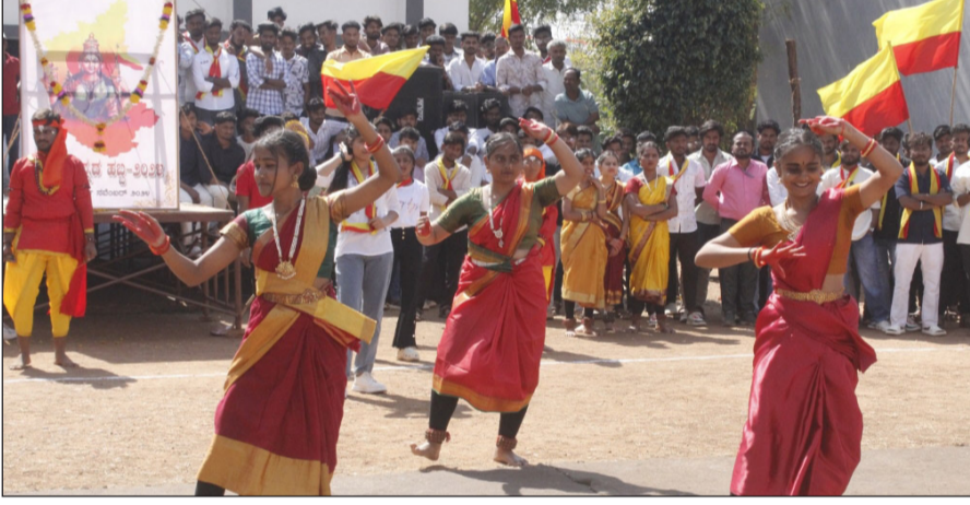
ನಡೆದ ಕನ್ನಡ ಹಬ್ಬ ಕಾರ್ಯಕ್ರಮದಲ್ಲಿ ವಿಶೇಷ ವಿದ್ಯಾರ್ಥಿಗಳಿಗೆ ಪ್ರಶಸ್ತಿ ನೀಡಿ ಗೌರವಿಸಲಾಯಿತು.