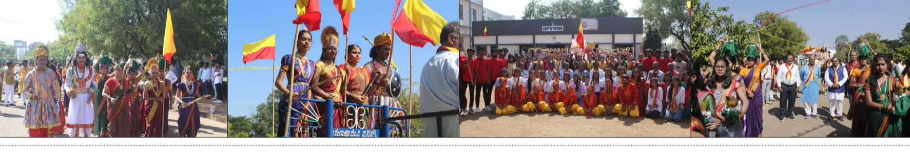
ಡಾ. ಎಂ.ಎಂ. ಕಲಬುರ್ಗಿ ಅವರ 86ನೇ ಜನ್ಮ ದಿನಾಚರಣೆ, ರಾಷ್ಟ್ರೀಯ ಪ್ರಶಸ್ತಿ ಪ್ರದಾನ