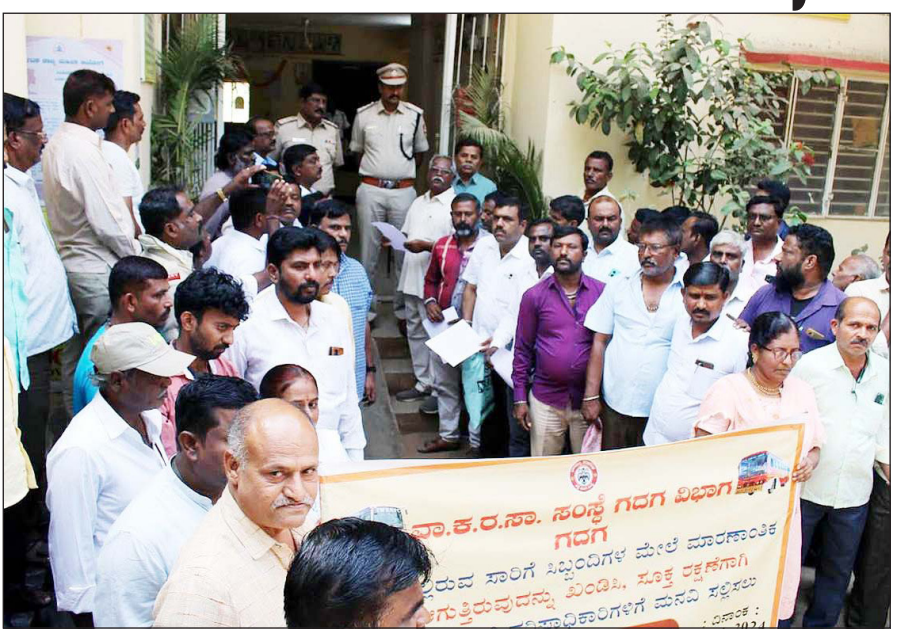
ದಾರಿ ಚೀಟಿ ನೀಡಲು ಬಸ್ ನಿಲ್ಲಿಸುತ್ತಿದ್ದಂತೆಯೇ ಪ್ರಯಾಣಿಕರು ಡ್ರೈವರ್-ಕಂಡಕ್ಟರ್ ಮೇಲೆ ಸಿಟ್ಟಾಗುವರು. ಭೈರಾಪುರದ ಅಷ್ಟೇ ಅಲ್ಲದ ವಾಗ್ವಾಡಕ್ಕಿಳಿದು ಹಲ್ಲೆ ನಡೆಸುವಂತಹ ಕೃತ್ಯ ನಡೆಸುತ್ತಿರುವುದು ಕಳವಳಕಾರಿ ಘಟನೆಯಾಗಿದೆ.

ರಾಜ್ಯ ಸರ್ಕಾರದ ಮಹತ್ವಾಕಾಂಕ್ಷಿ ಯೋಜನೆಯಾದ ಶಕ್ತಿ ಯೋಜನೆಯನ್ನು ಯಶಸ್ವಿಯಾಗಿ ಅನುಷ್ಠಾನಗೊಳಿಸಲು ಡ್ರೈವರ್, ಕಂಡಕ್ಟರ್‌ಗಳು ಶ್ರಮಿಸುತ್ತಿದ್ದಾರೆ. ಶಕ್ತಿ ಯೋಜನೆಯಿಂದಾಗಿ ಬಸ್‌ಗಳಲ್ಲಿ ಪ್ರಯಾಣಿಕರ ಸಂಖ್ಯೆ ಹೆಚ್ಚಿರುವುದರಿಂದ ದುಷ್ಕರ್ಮಿ, ಗದ್ದಲ ಹೆಚ್ಚಾಗುತ್ತಿದೆ. ಸ್ಪೆಷ್ ಬಾಡುವುಗಳಿಗೆ ದಾರಿ ಚೀಟಿ ನೀಡಬೇಕಾದ ನಿಯಮ ಇರುವುದರಿಂದ