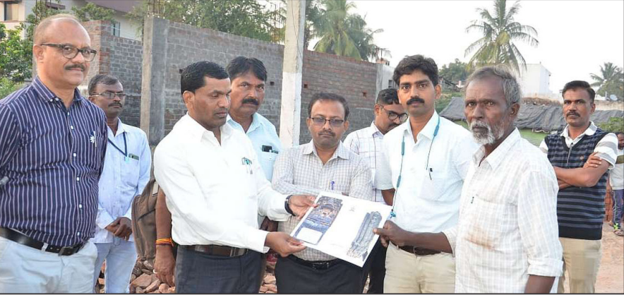
ಲಕ್ಕುಂಡಿಯ ಪಾರಂಪರಿಕ, ಐತಿಹಾಸಿಕ ವೈಭವವನ್ನು ಪುನಃ ಸ್ಥಾಪಿಸುವ ಉದ್ದೇಶದಿಂದ ಲಕ್ಕುಂಡಿ ಗ್ರಾಮದಲ್ಲಿ ಹಮ್ಮಿಕೊಂಡಿರುವ ಪ್ರಾಚ್ಯವಶೇಷಗಳ ಅನ್ವೇಷಣೆ ಕಾರ್ಯದಲ್ಲಿ ಪ್ರತಿಯೊಬ್ಬರೂ ಪಾಲ್ಗೊಂಡು ಪ್ರಾಚ್ಯವಶೇಷಗಳ ಸಂಗ್ರಹಣೆ ಮಾಡುವ ಮೂಲಕ ಲಕ್ಕುಂಡಿಯ ವೈಭವವನ್ನು ಮತ್ತೆ ಸ್ಥಾಪಿಸೋಣ ಎಂಬ ಜಿಲ್ಲಾ ಉಸ್ತುವಾರಿ ಸಚಿವ ಎಚ್.ಕೆ. ಪಾಟೀಲರ ಮನವಿ ಪತ್ರವನ್ನು ಲಕ್ಕುಂಡಿ ಗ್ರಾಮದ ಪ್ರತಿ ಮನೆ ಮನೆಗೂ ತಲುಪಿಸಿ ಪ್ರಾಚ್ಯವಶೇಷಗಳ ಅನ್ವೇಷಣೆ ಕುರಿತು ಅರಿವು ಮೂಡಿಸಲಾಯಿತು.