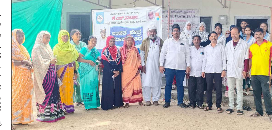
ವಿಭಾಗ ಮುಂಚೂಣಿ ಘಟಕದ ಹೆಚ್ಚು ಜನರಿಗೆ ಆರೋಗ್ಯ ತಪಾಸಣೆ ಹಾಗೂ ಕಣ್ಣಿನ ತಪಾಸಣೆ ಮಾಡಲಾಯಿತು. ಕಾಂಗ್ರೆಸ್ ಮುಖಂಡರಾದ ಶಿಬಿರದಲ್ಲಿ ಕೆ.ಎಚ್. ಕೆ. ಪಾಟೀಲರ ಜನಪರ ಕಾರ್ಯಗಳಿಗೆ ಸಾರ್ವಜನಿಕರು ಪ್ರಶಂಸೆ ವ್ಯಕ್ತಪಡಿಸಿದರು.