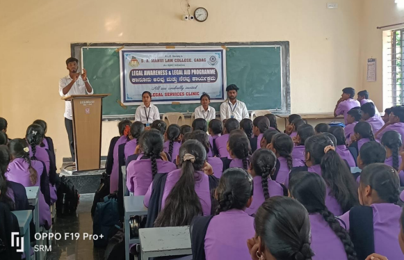
ಶರವರ ಸಿದ್ಧಲಿಂಗೇಶ್ವರ ನಗರದಲ್ಲಿರುವ ಸರ್ಕಾರಿ ಪದವಿ