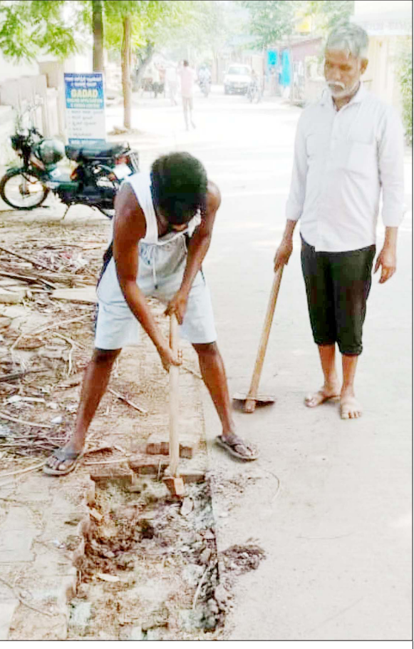
ಗದಗ-ಬೆಟಗೇರಿ ನಗರಸಭೆಯ ಅಧಿಕಾರಿಗಳು ಅವಳಿ ನಗರದಲ್ಲಿ ನೀರಿನ ಕೆರೆ ಬಾಕಿ ಉಳಿಸಿಕೊಂಡಿರುವ ಹಾಗೂ ಅನಧಿಕೃತ ಸಂಪರ್ಕ ಹೊಂದಿದವರ ನಳಗಣನ್ನು ಬಂದ್ ಮಾಡುವ ಪ್ರಕ್ರಿಯೆಗೆ ಸೋಮವಾರ ಚಾಲನೆ ನೀಡಿದರು.