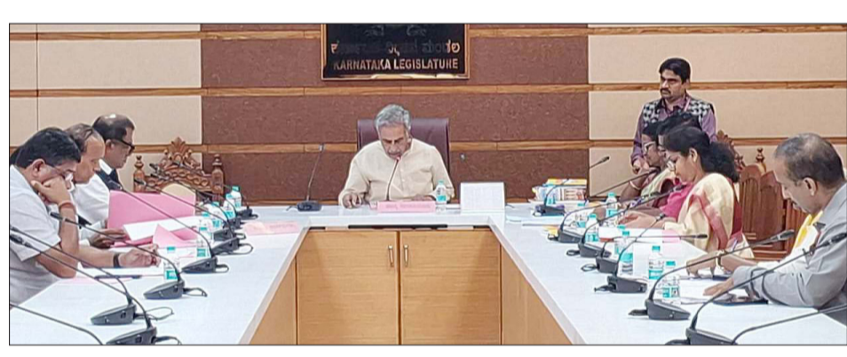
ನಿಯಮಾವಳಿಗಳ ಸಮಿತಿಯ ಪ್ರಾರಂಭಿಕ ಸಭೆಯ ಶತಮಾನದ ಇತಿಹಾಸ ಹೊಂದಿರುವ ಕರ್ನಾಟಕ ವಿಧಾನ ಪರಿಷತ್ತು ತನ್ನದೇ ಆದ ಘನತೆ ಗೌರವವನ್ನು