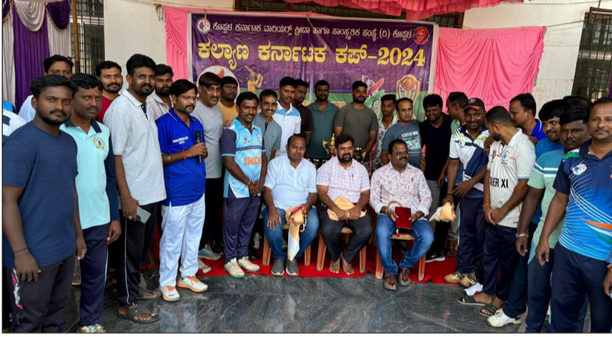
ಕಲ್ಯಾಣ ಕರ್ನಾಟಕ ಜಿಲ್ಲೆಗಳಲ್ಲಿ 3713 ಜಾರಿ ಮುನ್ನ ಈ ಭಾಗದ ಜನರಿಗೆ ಉದ್ಯೋಗಾವಕಾಶ, ಶಿಕ್ಷಣದ ಕೊರತೆ ಇತ್ತು. ಇದೀಗ ಆ ಸಮಸ್ಯೆ ಬಹುತೇಕ ಇತ್ಯರ್ಥವಾಗಿದ್ದರೂ ಸಣ್ಣಪುಟ್ಟ ದೋಷಗಳನ್ನು ಸರಿಪಡಿಸಬೇಕಿದೆ ಎಂದರು. ಮುಖ್ಯ ಅತಿಥಿಗಳಾಗಿ ಪಾಲ್ಗೊಂಡಿದ್ದ