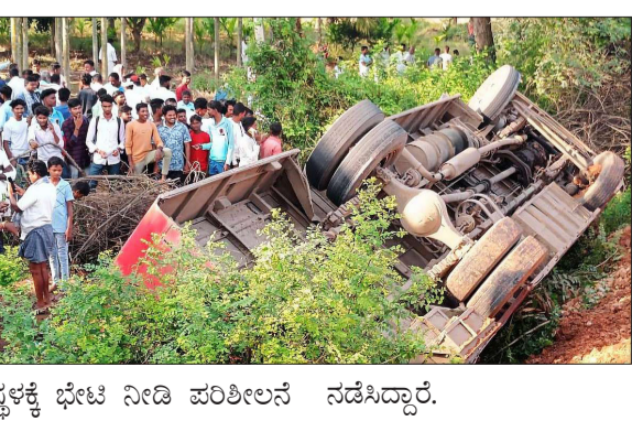
ಸ್ಥಳಕ್ಕೆ ಭೇಟಿ ನೀಡಿ ಪರಿಶೀಲನೆ ನಡೆಸಿದ್ದಾರೆ.