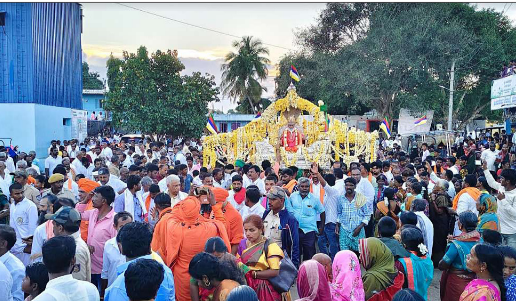
ದೇವಸ್ಥಾನದಲ್ಲಿ ದೇವರಿಗೆ ಸಿದ್ಧಪಡಿಸಿದ ಭವ್ಯ ಪಲ್ಲಕ್ಕಿಯಲ್ಲಿ ಬೀದಿಗಳ ಮೂಲಕ ಪಲ್ಲಕ್ಕಿ ಉತ್ಸವದ ಪೂಜೆ ಸಲ್ಲಿಸಿದ ಶ್ರೀಗಳು ಬೆಳ್ಳಿಯಿಂದ ಆಸೀನರಾದರು. ನಂತರ ಪ್ರಮುಖ ಮೆರವಣಿಗೆ ಸಾಗಿ ಬಂದಿತು.

ಶ್ರೀಗಳು ಬಂಗಾರದ ಕಿರೀಟ ಧರಿಸಿಕೊಂಡು ಅಡ್ಡಪಲ್ಲಕ್ಕಿ ಏರುವ ದೃಶ್ಯವನ್ನು ಏಕಕಾಲಕ್ಕೆ ಭಕ್ತರು ವೀಕ್ಷಿಸಲು ಹಾತೊರೆಯುತ್ತಿದ್ದರು. ನಯನಮನೋಹರವಾದ ಈ ದೃಶ್ಯದಲ್ಲಿ ಶ್ರೀಗಳು ಮಂದಸ್ಥಿತರಾಗಿ ಭಕ್ತರನ್ನು ಆತೀರ್ವದಿಸುತ್ತಾ ಹಸನ್ಮುಖಿಯಾಗಿ ವಿರಾಜಮಾನರಾಗಿದ್ದರು.