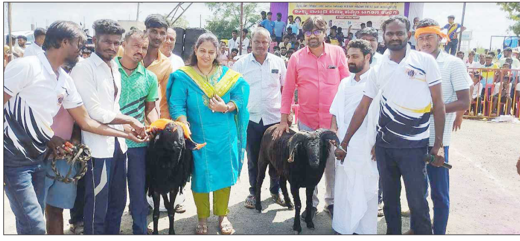
ನಿನ್ನೆಯದ್ದಲ್ಲ. ಪ್ರಾಚೀನ ಕಾಲದ ಗ್ರಾಮೀಣ ಕ್ರೀಡೆ ಇದಾಗಿದ್ದು ರಾಜರ ಕಾಲದಲ್ಲಿ ಸಮ ಬಲದ ರಾಜರು ಯುದ್ಧದ ಕೊನೆಯ ಸಂದರ್ಭದಲ್ಲಿ ಎರಡು ರಾಜ್ಯದ ರಾಜರುಗಳು ತಮ್ಮ