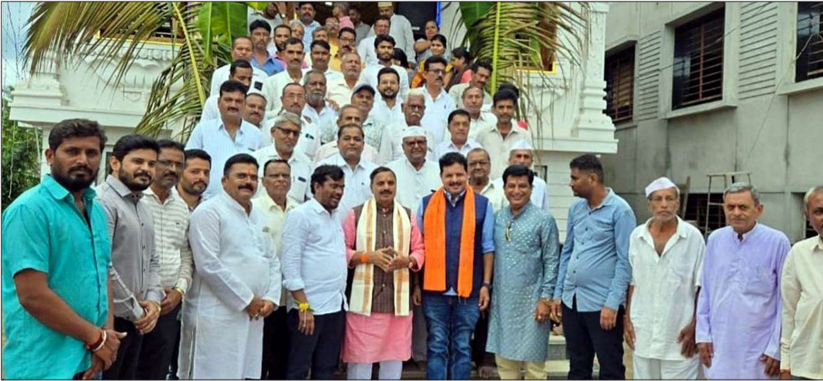
ಮಕ್ಕಳಿಗೆ ಉತ್ತಮ ಸಂಸ್ಕಾರ, ಸಂಪ್ರದಾಯಗಳನ್ನು ಕಲಿಸುವ ಜೊತೆಗೆ ಸಮಾಜದ ಧಾರ್ಮಿಕ

ಅವರು ಪಟ್ಟಣದ ಶ್ರೀ ಅಂಭಾಭವಾನಿ ದೇವಸ್ಥಾನದಲ್ಲಿ ಎಸ್‌ಎಸ್‌ಕೆ ಸಮಾಜದ ವತಿಯಿಂದ ನವರಾತ್ರಿ ಅಂಗವಾಗಿ ಏರ್ಪಡಿಸಿದ್ದ ಕಾರ್ಯಕ್ರಮದಲ್ಲಿ ಭಾಗವಹಿಸಿ ಸಮಾಜದ ವತಿಯಿಂದ ನೀಡಿದ ಸನ್ಮಾನವನ್ನು ಸ್ವೀಕರಿಸಿ ಮಾತನಾಡಿದರು.