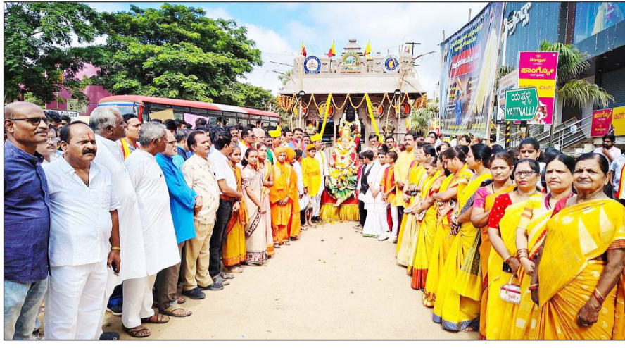
ಅವರ ಆದರ್ಶ ಗುಣಗಳನ್ನು ಬೆಳೆಸಿಕೊಳ್ಳಬೇಕು ಎಂದು ಹೇಳಿದರು.

■ ವಿಜಯಸಾಕ್ಷಿ ಸುದ್ದಿ, ಗದಗ ಮಂಡ್ಯದಲ್ಲಿ ಡಿಸೆಂಬರ್‌ನಲ್ಲಿ ಜರುಗಲಿರುವ 87ನೇ ಅಖಿಲ ಭಾರತ ಕನ್ನಡ ಸಾಹಿತ್ಯ ಸಮ್ಮೇಳನದ ಪ್ರಯುಕ್ತ ರಾಜ್ಯಾದ್ಯಂತ ಸಂಚರಿಸುತ್ತಿರುವ ಕನ್ನಡ ಜ್ಯೋತಿ ರಥವು, ಗದಗ ಜಿಲ್ಲೆಯ ಲಕ್ಷ್ಮೀಶ್ವರ ಪಟ್ಟಣಕ್ಕೆ ಶನಿವಾರ ಆಗಮಿಸಿತು.