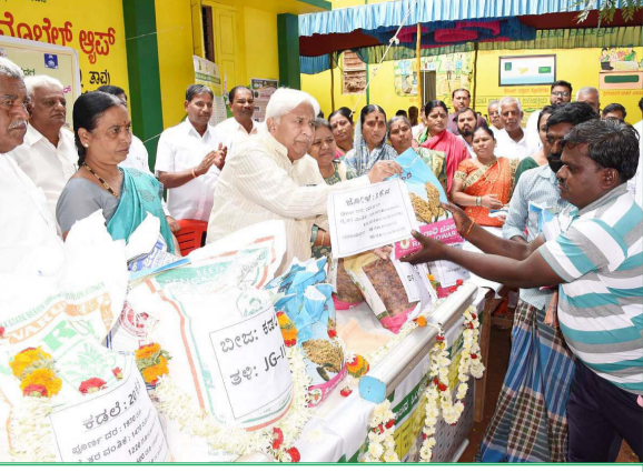
ಗದಗ ತಾಲೂಕಿನ ಹುಲಕೋಟೆ ಗ್ರಾಮದ ರೈತ ಸಂಪರ್ಕ ಕೇಂದ್ರದ ಆವರಣದಲ್ಲಿ ಗೋರಾಮು ನಿರ್ಮಾಣ ಕಾಮಗಾರಿಗೆ ಜಿಲ್ಲಾ ಉಸ್ತುವಾರಿ ಸಚಿವ ಎಚ್.ಕೆ. ಪಾಟೀಲ ಚಾಲನೆ ನೀಡಿದರು. ಇದೇ ಸಂದರ್ಭದಲ್ಲಿ ಅವರು ಬಿತ್ತನೆ ಬೀಜ ಹಾಗೂ ಕೃಷಿ ಪರಿಕರಗಳನ್ನು ರೈತರಿಗೆ ವಿತರಿಸಿದರು.

■ ವಿಜಯಸಾಕ್ಷಿ ಸುದ್ದಿ, ಗದಗ ಮಂಡ್ಯದಲ್ಲಿ ಡಿಸೆಂಬರ್‌ನಲ್ಲಿ ಜರುಗಲಿರುವ 87ನೇ ಅಖಿಲ ಭಾರತ ಕನ್ನಡ ಸಾಹಿತ್ಯ ಸಮ್ಮೇಳನದ ಪ್ರಯುಕ್ತ ರಾಜ್ಯಾದ್ಯಂತ ಸಂಚರಿಸುತ್ತಿರುವ ಕನ್ನಡ ಜ್ಯೋತಿ ರಥವು, ಗದಗ ಜಿಲ್ಲೆಯ ಲಕ್ಷ್ಮೀಶ್ವರ ಪಟ್ಟಣಕ್ಕೆ ಶನಿವಾರ ಆಗಮಿಸಿತು.