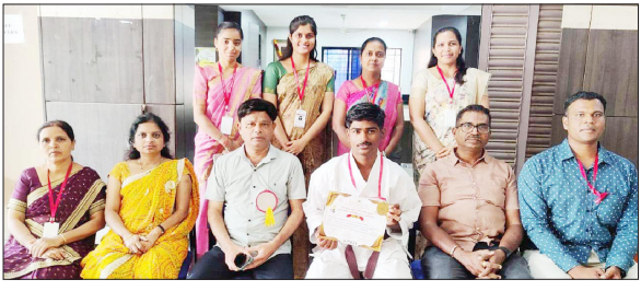
ವಿಜಯಸಾಕ್ಷಿ ಸುದ್ದಿ, ಗದಗ