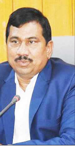
ರಾಜ್ಯಗಳು/ಯು.ಪಿ.ಗಳಲ್ಲಿ ಎಲ್ಲಾ ಬುಡಕಟ್ಟು

■ ವಿಜಯಸಾಕ್ಷಿ ಸುದ್ದಿ, ಗದಗ ನಿರ್ದಿಷ್ಟ ಮಧ್ಯಸ್ಥಿಕೆಗಳೊಂದಿಗೆ ಮಹತ್ವಾಕಾಂಕ್ಷಿಯ ಜಿಲ್ಲೆಗಳಲ್ಲಿ 63 ಸಾವಿರಕ್ಕೂ ಹೆಚ್ಚು ಬುಡಕಟ್ಟು ಬಹುಸಂಖ್ಯಾತ ಗ್ರಾಮಗಳು ಮತ್ತು ಬುಡಕಟ್ಟು ಹಳ್ಳಿಗಳನ್ನು ಸಂಸ್ಕೃತಗೊಳಿಸುವ ಗುರಿಗಳನ್ನು ಹೊಂದಿರುವ ಪ್ರಧಾನಮಂತ್ರಿ ಜನಜಾತಿಯ ಉನ್ನತ ಗ್ರಾಮ ಅಭಿಯಾನಕ್ಕೆ ಕೇಂದ್ರ ಸಚಿವ ಸಂಪುಟ ಅನುಮೋದನೆ ನೀಡಿದೆ. ಮಿಷನ್‌ಗಾಗಿ ಬಜೆಟ್ ವೆಚ್ಚವು ಬುಡಕಟ್ಟು ಸಮುದಾಯಗಳ ಸಾಮಾಜಿಕ ಅರ್ಥಿಕ ಸ್ಥಿತಿಯನ್ನು ಸುಧಾರಿಸಲು 79,156 ಕೋಟಿ ರೂ ಇದ್ದು, ಈ ಮಿಷನ್ 549 ಜಿಲ್ಲೆಗಳು ಮತ್ತು 2,740 ಬ್ಲಾಕ್‌ಗಳನ್ನು 30