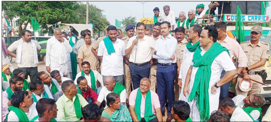
ಬಾಯಿ ಬಡಿದುಕೊಂಡರೆ, ರೈತರು ಅರೆಬೆತ್ತಲೆಯಾಗಿ ಧಿಕ್ಕಾರ ಕೂಗಿದರು.

■ ವಿಜಯಸಾಕ್ಷಿ ಸುದ್ದಿ, ಗದಗ ಕಡಲೆ ಖಲೀದಿ ವಿಚಾರದಲ್ಲಿ ರೈತರಿಗೆ ಮೋಸವಾಗಿದೆ. ಕಡಲೆ ಖಲೀದಿಸಿ, ರೈತರಿಗೆ ಅದರ ಬಾಕಿ ಹಣ 6.50 ಕೋಟಿ ರೂ ಕೊಡಲೇ ಸತಾಯಿಸುತ್ತಿರುವವರ ವಿರುದ್ಧ ಜಿಲ್ಲಾಡಳಿತ ಕಠಿಣ ಕ್ರಮವಹಿಸಬೇಕು. ಬಾಕಿ ಉಳಿಸಿಕೊಂಡಿರುವ ಹಣವನ್ನು ಕೂಡಲೇ ರೈತರಿಗೆ ಕೊಡಿಸಬೇಕು. ಇಲ್ಲವಾದಲ್ಲಿ ಅಹೋರಾತ್ರಿ ಧರಣಿ ನಡೆಸಲಾಗುವುದು ಎಂದು ಮುಂಡರಗಿ ಹಾಗೂ ಗದಗ ತಾಲೂಕಿನ ರೈತರು ಜಿಲ್ಲಾಡಳಿತ ಭವನದ ಎದುರು ಸೋಮವಾರ ಬೃಹತ್ ಪ್ರತಿಭಟನೆ ನಡೆಸಿದರು.