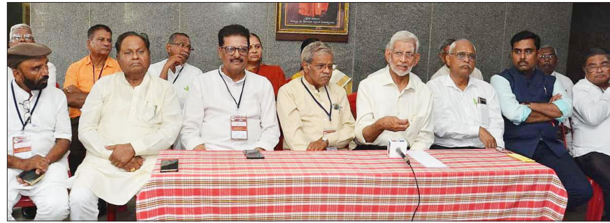
ವಾರ್ಷಿಕ ಮಹಾಸಭೆಯ ನಿರ್ಣಯಗಳು