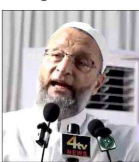
ಪ್ರಧಾನ ಕಚೇರಿಯಲ್ಲಿ ಸಭೆಯನ್ನು ಉದ್ದೇಶಿಸಿ ಮಾತನಾಡಿದ ಓಪ್ಪಿಸಿ.

■ ವಿಜಯಸಾಕ್ಷಿ ಸುದ್ದಿ, ಹೈದರಾಬಾದ್ ಕೇಂದ್ರ ಗೃಹ ಖಾತೆ ರಾಜ್ಯ ಸಚಿವ ಬಂಡಿ ಸಂಜಯ್ ಕುಮಾರ್ ಅವರ "ಮದರಾಸುಗಳು ತನ್ನ ವಿವಿಧೋದ್ದೇಶಗಳಿಗೆ ಎಕ್-47 ರೈಫಲ್‌ಗಳನ್ನು ಬಳಸುವ ಬಗ್ಗೆ ತರಬೇತಿ ನೀಡುತ್ತಿವೆ" ಎಂಬ ಹೇಳಿಕೆಗೆ ಎಎಎಂಐಎಂ ಅಧ್ಯಕ್ಷ ಅಸಾದುದ್ದೀನ್ ಓಪ್ಪಿಸಿ ಅವರು ತಿರುಗೇಟು ನೀಡಿದ್ದಾರೆ. ಹೈದರಾಬಾದ್‌ನ ಎಎಎಂಐಎಂ