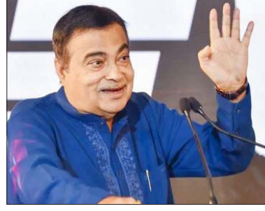
ವಿಶ್ವವಿದ್ಯಾಲಯದಲ್ಲಿ ಶುಕ್ರವಾರ ನಡೆದ ಪ್ರಸಕ್ತ ಬಿಡುಗಡೆ ಸಮಾರಂಭದಲ್ಲಿ ಹೇಳಿದರು. "ರಾಜನು ತನ್ನ ವಿರುದ್ಧದ ಬಲವಾದ

■ ವಿಜಯಸಾಕ್ಷಿ ಸುದ್ದಿ, ನವದೆಹಲಿ 'ಆಡಳಿತಗಾರನು ತನ್ನ ವಿರುದ್ಧದ ಬಲವಾದ ಅಭಿಪ್ರಾಯವನ್ನು ಸಹಿಸಿಕೊಳ್ಳುತ್ತಾನೆ, ಅದು ಆತ್ಮಾವಲೋಕನಕ್ಕೆ ಕಾರಣವಾಗುತ್ತದೆ. ಭಿನ್ನಾಭಿಪ್ರಾಯ ಸಹಿಸಿಕೊಳ್ಳುವುದೇ ಪ್ರಜಾಪ್ರಭುತ್ವದ ಅತಿದೊಡ್ಡ ಪರಿಚ್ಛೇ' ಎಂದು ಕೇಂದ್ರ ರಸ್ತೆ ಸಾರಿಗೆ ಮತ್ತು ಹೆದ್ದಾರಿ ಸಚಿವ ನಿತಿನ್ ಗಡ್ಕರಿ ಹೇಳಿದ್ದಾರೆ. ಲೇಖಕರು ಮತ್ತು ಬುದ್ಧಿಜೀವಿಗಳು ನಿರ್ಭೀತಿಯಿಂದ ತಮ್ಮ ಅಭಿಪ್ರಾಯ ವ್ಯಕ್ತಪಡಿಸಬೇಕು ಎಂದು ಬಿಜೆಪಿಯ ಹಿರಿಯ ಮುಖಂಡ ಎಂಟಿಎ ವರ್ಲ್ಡ್ ಪೀಸ್