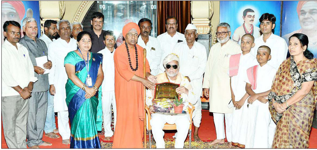
ಬರೀ ಮಾತುಗಳಲ್ಲಿ ಸೀಮಿತವಾದರೆ ಸಾಲದು. ಧರ್ಮಸಹಿಷ್ಣುತೆ ಭಾವ ಮೂಡಬೇಕಾದರೆ, ಬೆಳೆಯಬೇಕಾದರೆ, ಬದುಕಬೇಕಾದರೆ ಪ್ರತಿಯೊಬ್ಬರು ಶಾಂತಿ, ಸಮಾನತೆ, ಸೌಹಾರ್ದತೆಯಿಂದ ನಡೆದುಕೊಳ್ಳಬೇಕು. ಇಸ್ಲಾಂ, ಕ್ರಿಶ್ಚಿಯನ್, ಪಾರ್ಸಿ, ಜೈನ್, ಬೌದ್ಧ ಎಲ್ಲಾ ಧರ್ಮಗಳೂ ಸುರು ಸಂದೇಶ ಒಂದೇ. ಭಾವನೆ ಮೂಡುತ್ತದೆ ಎಂದರು.