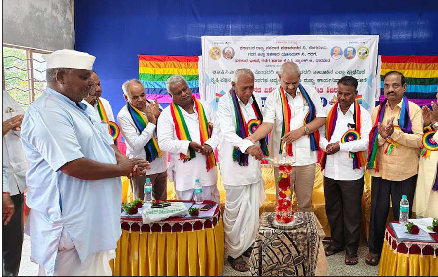
ಪ್ರಸ್ತುತ ಅವಧಿಯಲ್ಲಿರುವ 3 ವ್ಯಾಕ್ಟ್ ಸಂಘಗಳ ನಡುವೆ ಒಂದರಂತೆ ಕೆ.ಸಿ.ಸಿ. ಬ್ಯಾಂಕಿನ ನೂತನ ಶಾಖೆಯನ್ನು ಪ್ರಾರಂಭಿಸುವ ಉದ್ದೇಶವನ್ನು ಮುಂದಿನ 5 ವರ್ಷಗಳ ಅವಧಿಯಲ್ಲಿ ಯೋಜನೆಯಲ್ಲಿ ಹಾಕಿಕೊಳ್ಳಲಾಗಿದೆ ಎಂದು ಹೇಳಿದರು.

■ ವಿಜಯಸಾಕ್ಷಿ ಸುದ್ದಿ, ಗದಗ ಕರ್ನಾಟಕ ರಾಜ್ಯ ಸಹಕಾರ ಮಹಾಮಂಡಳ ನಿ. ಬೆಂಗಳೂರು, ಗದಗ ಜಿಲ್ಲಾ ಸಹಕಾರ ಯೂನಿಯನ್ ನಿ., ಗದಗ ಸಹಕಾರ ಇಲಾಖೆ, ಹಾಗೂ ಕೆ.ಸಿ.ಸಿ. ಬ್ಯಾಂಕ್ ಲಿ., ಧಾರವಾಡ ಇವರುಗಳ ಸಂಯುಕ್ತ ಆಶ್ರಯದಲ್ಲಿ ಟಿ.ಎ.ಪಿ.ಸಿ.ಎಂ. ಎಸ್.ಲಿ., ಮುಂಡರಗಿ ಹಾಗೂ ಮುಂಡರಗಿ ತಾಲೂಕಿನ ಎಲ್ಲಾ ಪ್ರಾಥಮಿಕ ಕೃಷಿ ಪತ್ತಿನ ಸಹಕಾರ ಸಂಘಗಳ ಅಧ್ಯಕ್ಷರು ಹಾಗೂ ಮುಖ್ಯ ಕಾರ್ಯನಿರ್ವಾಹಕರುಗಳಿಗೆ ಒಂದು ದಿನದ ವಿಶೇಷ ಸಹಕಾರ ತರಬೇತಿ ಶಿಬಿರವನ್ನು ಕೆ.ಸಿ.ಸಿ. ಬ್ಯಾಂಕ್ ಸಭಾಭವನದಲ್ಲಿ ಶುಕ್ರವಾರ ಜರುಗಿತು. ಕಾರ್ಯಕ್ರಮವನ್ನು ಉದ್ಘಾಟಿಸಿದ ಧಾರವಾಡ ಕೆ.ಸಿ.ಸಿ.