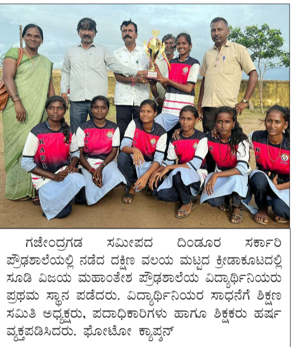
ಗಜೇಂದ್ರಗಡ ಸಮೀಪದ ದಿಂದೂರ ಸರ್ಕಾರಿ ಪ್ರೌಢಶಾಲೆಯಲ್ಲಿ ನಡೆದ ದಕ್ಷಿಣ ವಲಯ ಮಟ್ಟದ ಕ್ರೀಡಾಕೂಟದಲ್ಲಿ ಸೂಡಿ ವಿಜಯ ಮಹಾಂತೇಶ ಪ್ರೌಢಶಾಲೆಯ ವಿದ್ಯಾರ್ಥಿನಿಯರು ಪ್ರಥಮ ಸ್ಥಾನ ಪಡೆದರು. ವಿದ್ಯಾರ್ಥಿನಿಯರ ಸಾಧನೆಗೆ ಶಿಕ್ಷಣ ಸಮಿತಿ ಅಧ್ಯಕ್ಷರು, ಪದಾಧಿಕಾರಿಗಳು ಹಾಗೂ ಶಿಕ್ಷಕರು ಹರ್ಷ ವ್ಯಕ್ತಪಡಿಸಿದರು. ಘೋಟೋ ಕ್ಯಾಪ್ಷನ್

■ ವಿಜಯಸಾಕ್ಷಿ ಸುದ್ದಿ, ನರೇಗಾ ಪಟ್ಟಣದ ಶ್ರೀ ಅನ್ನದಾನೇಶ್ವರ ಶಿವಾನುಭವ ಮಂಟಪದಲ್ಲಿ ಶ್ರೀ ಅನ್ನದಾನೇಶ್ವರ ಸಂಸ್ಥಾನ ಮಠ, ಅಕ್ಷರ ಭಾರತ ಪ್ರತಿಷ್ಠಾನ ಗದಗ ಹಾಗೂ ಶ್ರೀ ಅನ್ನದಾನ ವಿಜಯ ವಿದ್ಯಾ ಪ್ರಸಾರಕ ಸಮಿತಿ ಇವುಗಳ ಸಂಯುಕ್ತ ಆಶ್ರಯದಲ್ಲಿ 53ನೇ ಶಿವಾನುಭವ ಗೋಷ್ಠಿಯು ಶನಿವಾರ ಸಂಜೆ 6.30ಕ್ಕೆ ಜರುಗಲಿದೆ.